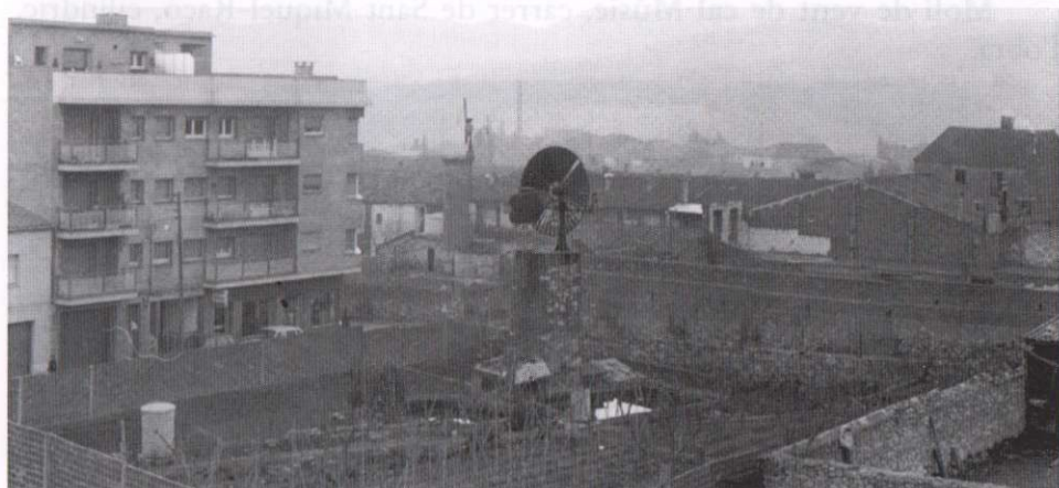
Antics horts de l'actual Pl. de Josep M. Folch i Torres coneguda per la Plaça del Molí. 1970

Molí de vent dels horts del Baldiri (1880)?, carrer Clavé-Dr. Rovira, cilíndric, d'obra. Té una mina que li aporta aigua, d'uns 50 m. de llar-