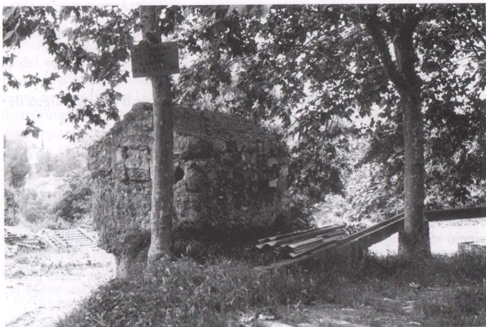
Caseta distribuïdora d'aigua situada al paratge del Castell de Castellar.