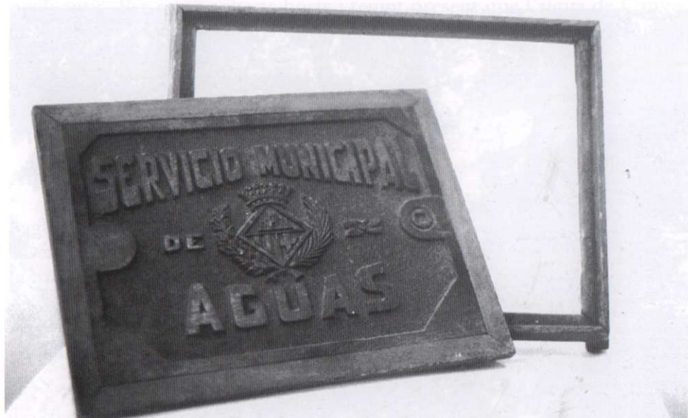
Talla de fusta per a la confecció en fosa de ferro colat d'un dels models de tapes de comptadors municipals d'aigua. AHC.

Mencionar les tapes i comptadors d'aigua del servei que havia presat el senyor Gorina.