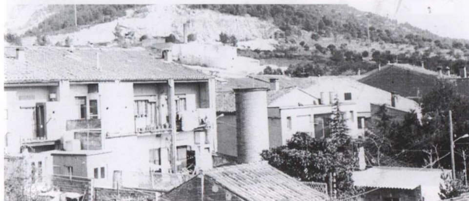
Molí de vent de cal «Música», al carrer del Racó