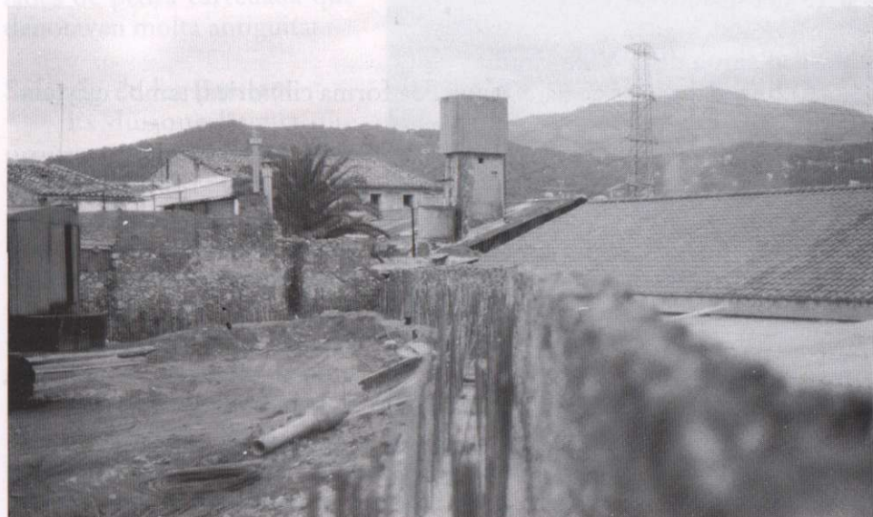
Dipòsit de l'antiga fàbrica de cal Coroninas, al carrer del Retir, avui desapareguda.

Al carrer del Retir, 2 (desaparegut). Situat dins el recinte de l'antiga fàbrica Coroninas, actualment enrunada i en vies de construcció d'habi-