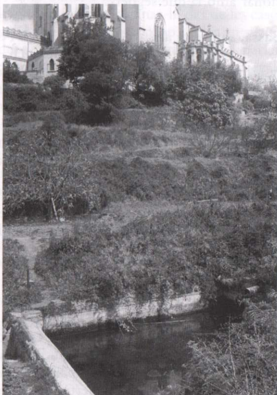
Font i bassa de les Bassetes

Es diu que l'aigua que proveeix aquesta bassa-safareig, prové d'una mina del carrer del Retir-Bassetes, doncs quan en aquesta cruïlla hi havia hagut l'antiga fàbrica Corominas i aquesta tintava, l'aigua d'aquests safareigs sortia de colors a l'igual que la d'un pou molt gran de la casa núm. 18, del carrer de les Bassetes coneguda com cal Ferrer del Pou o del Pont (Saiol).