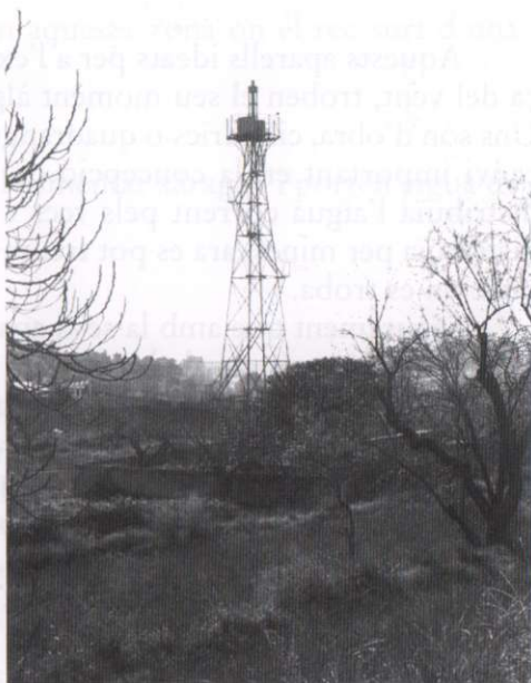
Molí de vent de cal Ribas, inicialment a l'inici del Torrent de Colobrers, prop l'actual rotonda, actualment dalt les Jeies com a torre de guaita. 1990

Molí de vent de cal Música , carrer de Sant Miquel-Racó, cilíndric, d'obra.