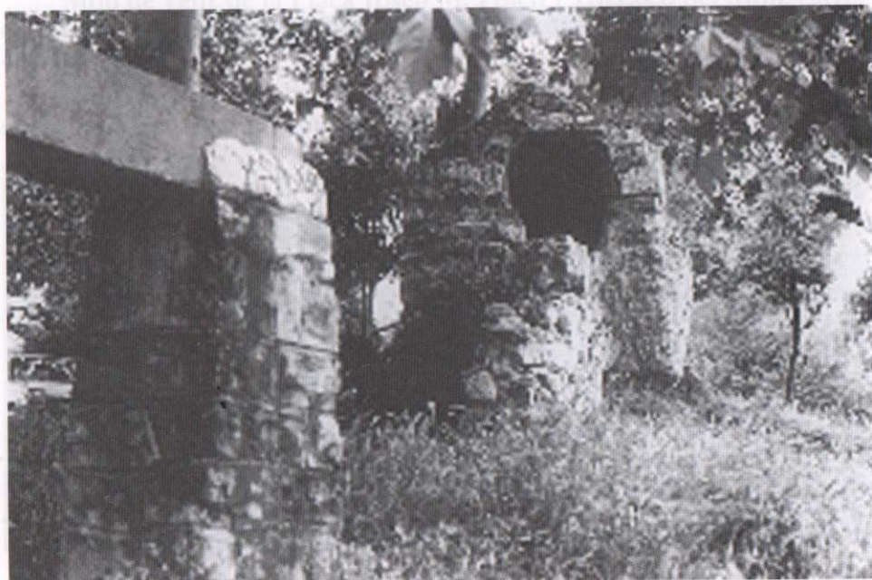
Caseta distribuïdora d'aigua i aqüeducte del Castell de Castellar.