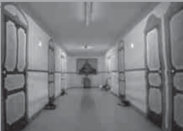
Muntatge: Visió del passadís