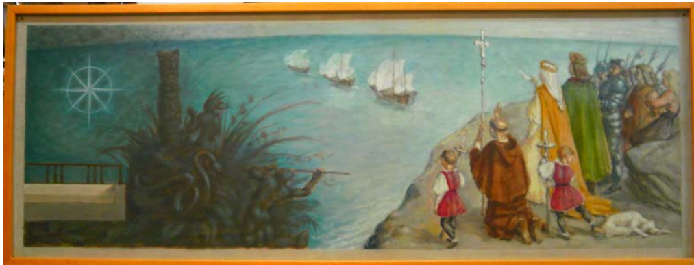
Boceto de Símbolo del gran viaje u origen de la Hispanidad

en uno de los principales símbolos para el discurso nacionalcatolicista en su defensa del concepto de Hispanidad. De entre los distintos capítulos protagonizados por la pareja de monarcas, se escogió como asunto de este primer mural el correspondiente al descubrimiento de América, acontecimiento que durante los cuarenta y cincuenta se convirtió en tema habitual para el campo de la ilustración, de la publicidad 25 e incluso del cine con la mítica Alba de América 26 , uno de los filmes más representativos del periodo, calificado incluso como película de interés nacional.