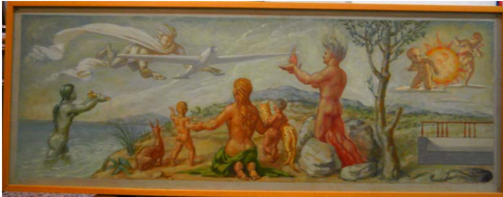
Boceto de Los elementos sometidos

Si en la primera pintura se recurrió a un tema histórico, el segundo mural estuvo dedicado a la Aviación, un asunto profano como es el progreso del Hombre, que plasmó en una alegoría moderna basada en la iconografía clásica.