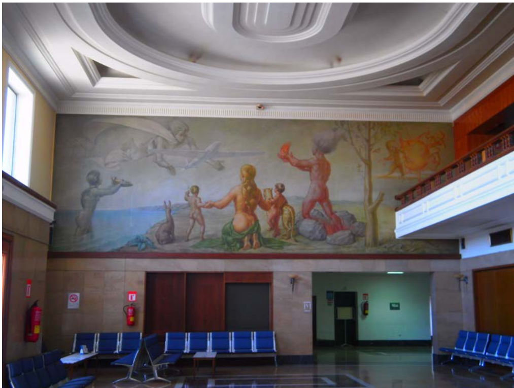
Los elementos sometidos