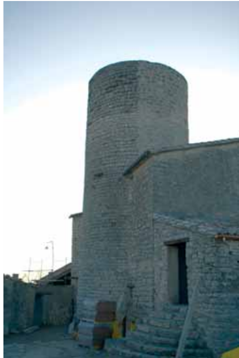
12. Vista general del castell de l'Ametlla de Segarra (Montoliu de Segarra)