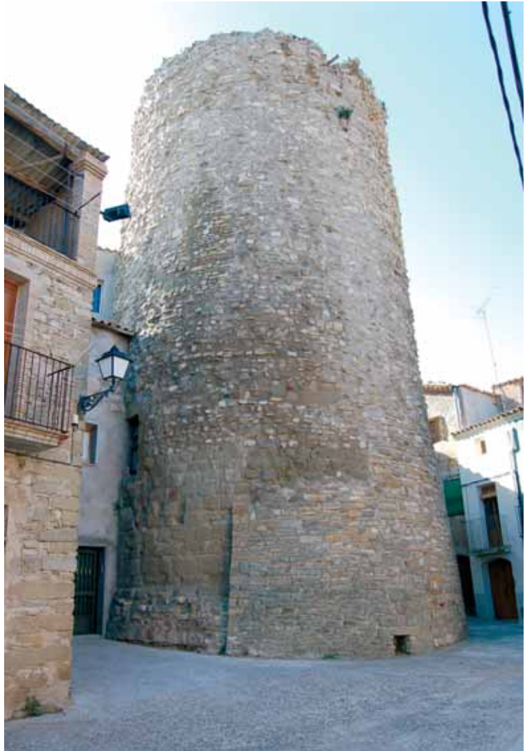
6. Vista general de la torre de Ivorra (Ivorra)

A la torre de Vallferosa (Torà) trobem que les úniques obertures corresponen a la porta