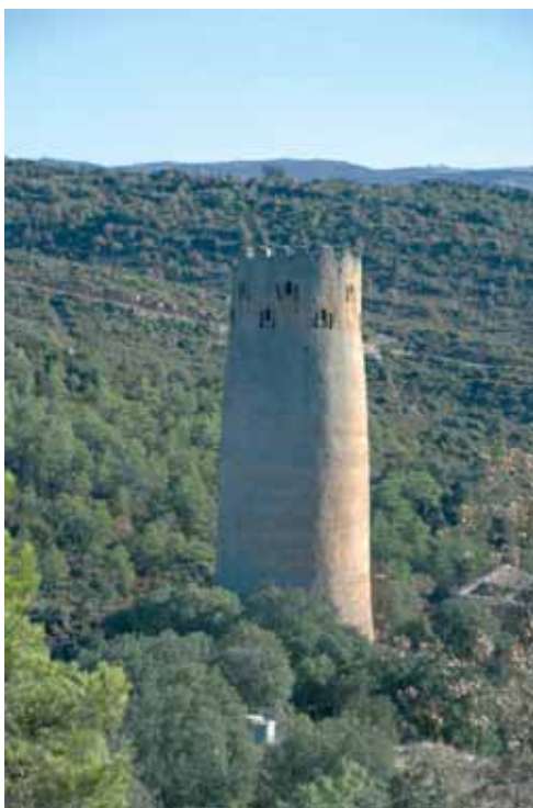
7. Vista general de la torre de Vallferosa (Torà)