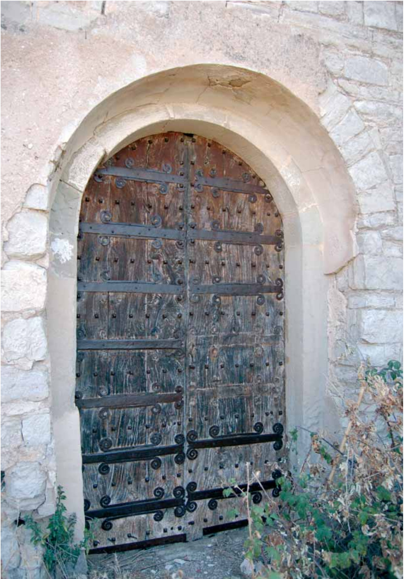
18. Detall de la decoració amb ferro de la porta d'accés a l'església parroquial de Santa Maria de Montlleó (Ribera d'Ondara)