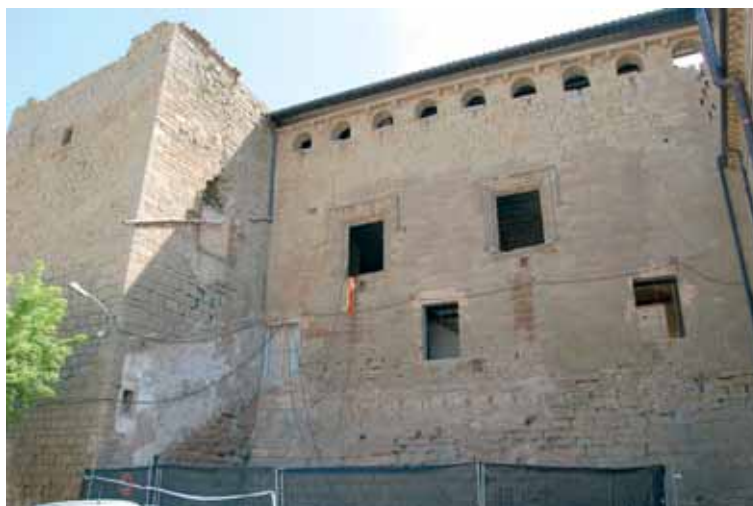
1. Vista general del castell de Concabella (els Plans de Sió).

Amb tot, cal fer un crit d'alerta davant el malt estat de conservació que presenten moltes torres de defensa i castells, malgrat el actuals esforços de les institucions municipals