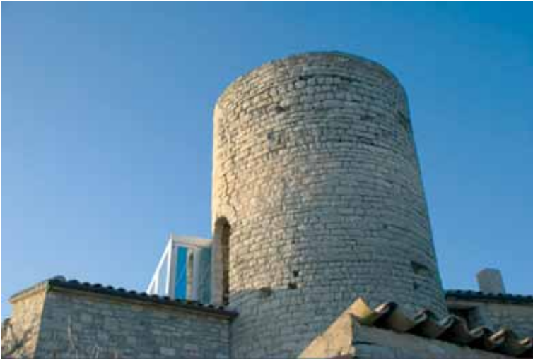
14. Detall de la porta d'accés del castell de Mejanell (Malacara, Estaràs)

senyorial destaquem la torre dels castells de Florejacs (Torrefeta i Florejacs), les Sitges (Torrefeta i Florejacs), Fonolleres (Granyanella), Curullada (Granyanella) i Malgrat (Cervera), etc., totes elles de planta quadrada i bastides amb carreus de pedra.