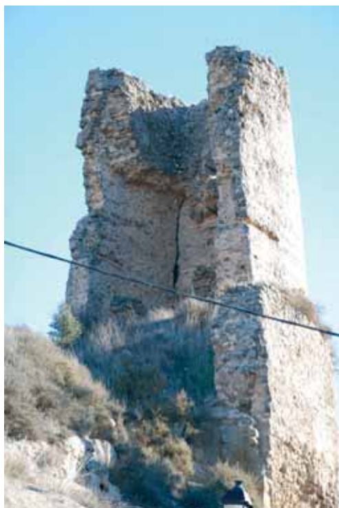
5. Vista interior de la torre del castell de Lloberola (Biosca)

Des dels punt de vista defensiu, les torres de planta rodona presenten notables avantatges. Aquestes tenen una major resistència davant els atacs dels enemics doncs la seva estructura cilíndrica no té angles i el volum d'obra per aconseguir una mateixa superfície és inferior. Tanmateix, aquestes permeten una millor visibilitat de l'entorn.