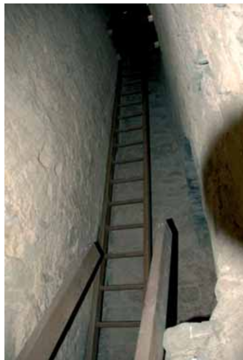
10. Vista interior de la caixa d'escapes de la torre de Vallferosa (Torà)