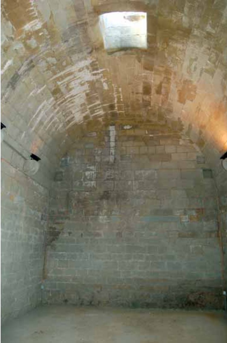
16. Vista interior de la cisterna del castell d'Ivorra (Ivorra)

La visió exterior d'aquest espai ve contextualitzada per un parament mural corregut, sense presentar cap tipus d'obertura i accessible per un únic portal. El exemple més notable per comprendre la construcció i funcionalitat d'aquesta estructura el tenim a Montfalcó Murallat (les Oluges) o al Mas de Bondia (Montornès de Segarra), on al pas del temps a preservat de forma natural, la seva primitiva estructura. En d'altres casos, aquest espai s'ha desdibuixat dins de l'actual topografia de les nostres viles i ciutats com es el cas dels nuclis de Santa Fe (les Oluges), Ivorra, Talavera, Cervera, Briançó (Ribera d'Ondara), Concabella (els Plans de Sió), el Canós (els Plans de Sió), la Manresana (Sant Ramon), Portell (Sant Ramon), Hostafrancs (Plans de Sió), Florejacs (Torrefeta i Florejacs), Granyadella, Granyena de Segarra (foto 15), Torà, Sanaüja, etc.