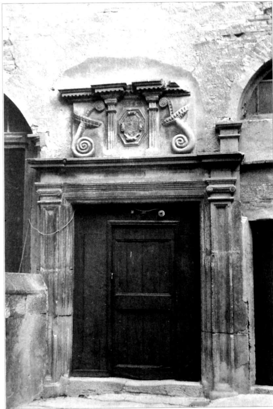
Porta renaixentista de l'abat de Guimerà, al castell de Verdú, situada al final de l'escala noble (1574).