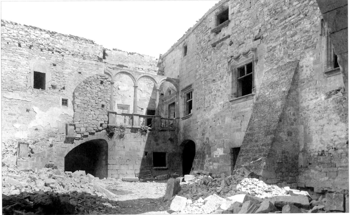
Pati principal del castell de Ciutadilla, on destaca l'escala noble, amb la seva galeria renaixentista. Aspecte que tenia el 1915.