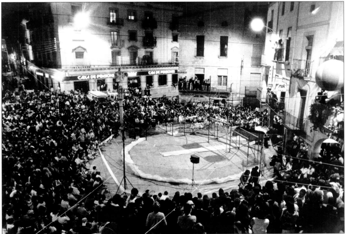
Les places i els carrers plens. Una constant de la fira del teatre targarina.