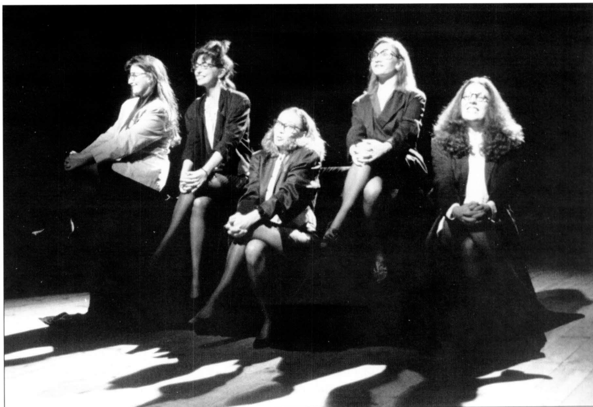
Any 1992. Dotzena Fira de Teatre al Carrer de Tàrraga. Èxit del grup T de Teatre. (Fotografia: Jesús Vilamajó).