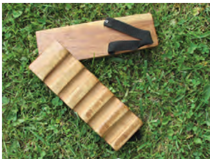
Rigo-rago. Extret de la informació de Joan Amades i reconstruït per en Donat Gallego