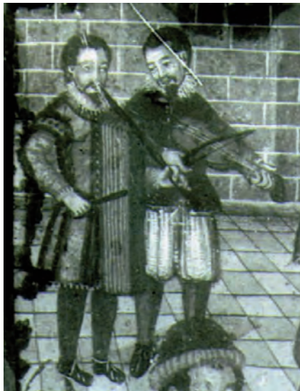
Retaula de l'església de Barruera, Vall de Boí

La modernitat es pot bastir amb diferents camins, però creiem que en tots aquests processos els fonaments i les arrels juguen un paper decisiu de continuació i equilibri. És probable que el manteniment de la melodia sigui fonamental a l'hora d'aguantar una peça musical, i la tendència a continuar amb els instruments considerats autòctons també. Paper que no