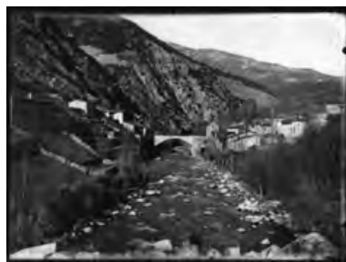
El pont de Bar construït el 1910 i destruït durant la riuada del novembre de 1982.

La Catalunya Romànica ja especifica clarament que "consta que fou volat pels francesos el 1794 i novament pels carlins el 1874. Li quedaven d'època medieval els dos estreps, sobre els murs de carreus romànics dels quals s'havien construït