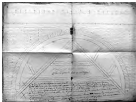
Croquis amb projectes de construcció del pont de Bar, l’any 1816.