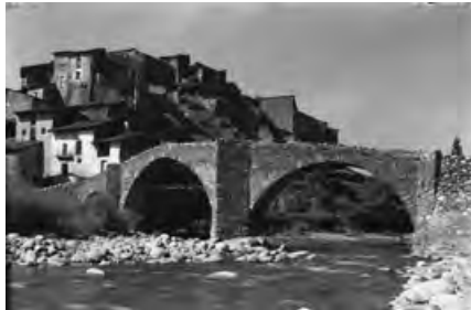
Pont de pedra d'Arfa, el primer terç del segle xx.

No obstant això, les dates en les quals trobem citat un pont de pedra en aquest indret són ben tardanes. Els capbreus d'Arfa dels anys 1635, 1665 i 1698 12 fan referència sempre a la palanca , amb aquest nom, i en cap cas s'esmenta cap pont , i el cadastre de l'any 1716 especifica, en parlar del poble, que "té una palanca". 13 El 1789 trobem referències a la Real Academia de Bellas Artes de San Fernando de Madrid sobre els projectes de construcció "de un nuevo puente de piedra en lugar del de madera que ahora tiene dicha villa". 14 Més endavant, el 1804, es diu clarament que el pont "es de madera", 15 el