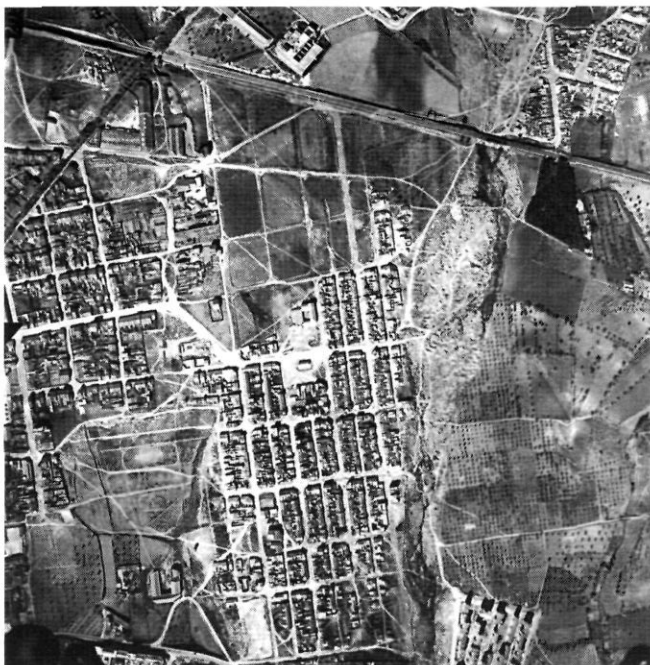
Ca n’Anglada 1958.

La població que arribà a Catalunya d’arreu de l’Estat espanyol, al llarg de la segona meitat del segle XX, s’instal·là als nous barris que –sense cap mena de serveis– nasqueren a totes les ciutats industrials de les comarques de Barcelona. Un d’aquests barris d’immigrants fets amb l’esforç dels seus veïns és Ca n’Anglada.