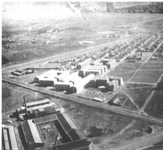
Ca n'Anglada 1964.

La majoria d'habitatges d'aquestes fases, exceptuant els de la Cooperativa de Sant Cristòfol, tenen aluminosi en diferent grau. La qualitat d'aquests habitatges, amb tot, era superior a la dels pisos construïts per l' Obra Sindical del Hogar y de Arquitectura . Els pisos fets a Ca n'Anglada eren d'iniciativa privada i d'un nivell de qualitat més elevat –per tal que es poguessin vendre– que els de l'OHS. El disseny i la qualitat dels habitatges de l'OHS era notòriament insuficient, ja que els materials són de baixa qualitat i les solucions arquitectòniques són força dolentes, i sobretot perquè tenen una manca total d'infraestructures i serveis. L'objectiu perseguit per l'OHS era produir