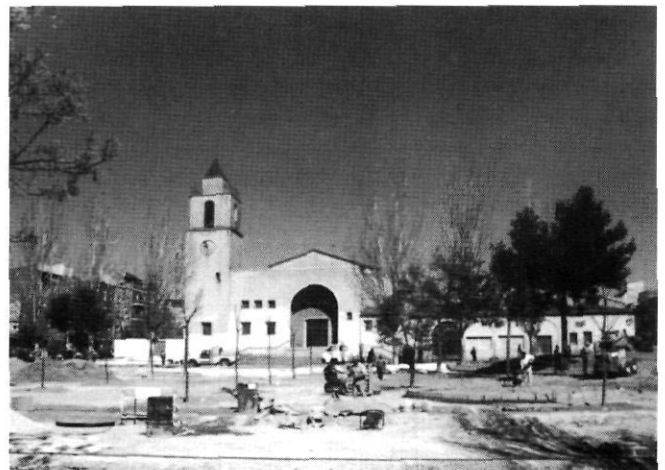
Obres a la plaça de Ca n'Anglada, 1995.

"(...) l'unitarisme, la solidaritat i uns procediments democràtics interns permeteren aplegar sectors de la població amb un origen social i geogràfic divers, políticament plurals i que responien a unes línies estratègiques i d'actuació també diversificades, i sovint enfrontades; la convivència de les quals, també sovint, no fou gens fàcil. La fusió dels elements eclesiàstics socialment avançats, un moviment cristià de base plural i progressista i un moviment polític de classe i socialista estructurarà un fort moviment veïnal que, de forma progressiva, va ser capaç no solament de denunciar determinades situacions i de reivindicar determinats serveis per al barri, sinó que també arribà a crear tot un sentiment ciutadà participatiu i reivindicatiu, que aportava solucions i alternatives per al conjunt de la societat; aconseguí il·lusionar amplis sectors de població del barri i fins i tot d'altres zones de Terrassa, en la lluita per una societat més justa, lliure i democràtica, posada com a model, enfront d'un sistema dictatorial injust, opressiu, afavoridor dels interessos dels poderosos i autoritari. En definitiva, aportà una visió i una solució globals als problemes de tot tipus existents". 15