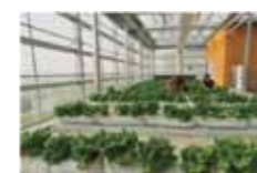
HUERTOS EN AZOTEAS PARA INVESTIGACIÓN HAI

aromáticas y flores comestibles. Descripción: Se puede ubicar en cualquier espacio doméstico (balcones, patios, interiores); de tamaño variable.