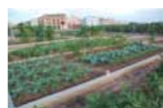
HUERTOS EN SUELO URBANO PRIVADO HSUPr

extensión de 11.000 m 2 , en los que se cultivan diversas hortalizas y se crían animales de corral.