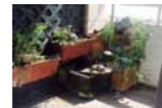
HUERTOS EN AZOTEAS DOMÉSTICOS HAD

Espacios agrícolas de propiedad privada o pública que ubican la zona de cultivo en la azotea del edificio. El cultivo es variado: plantas aromáticas, hortalizas y árboles frutales que se pueden usar para la investigación, el autoconsumo y el comercio. La forma del cultivo puede ser tradicional o de alta tecnología. Se enfoca a aspectos ambientales, nutricionales, recreativos y educativos, entre otros.