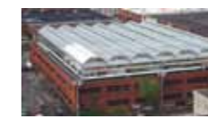
HUERTOS EN AZOTEAS PARA COMERCIO HAC