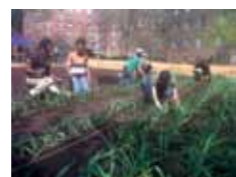
HUERTOS EN SUELO URBANO PÚBLICO HSUPu

Espacios agrícolas en suelo calificado como zona verde para su uso como huerto urbano. El cultivo es realizado de forma tradicional sobre el suelo y su producción es variada, como hortalizas, plantas aromáticas y árboles frutales. Suelen tener pequeños animales de granja. Pueden ser de titularidad privada o municipal. Los más comunes son los huertos en suelo urbano público (HSUPu), que son explotados por centros docentes y asociaciones sin ánimo de lucro, con el fin de satisfacer funciones ambientales y sociales.