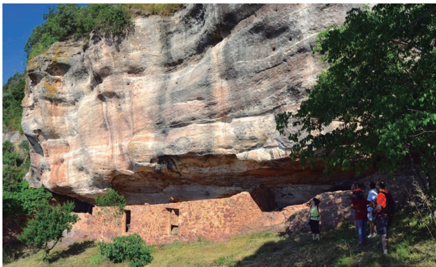
La simbiosi entre la natura i la mà humana és evident a aquest espai de la Baronia d'Escornalbou.

A nosaltres ens fa molta il·lusió recuperar la Baronia i aconseguir que els municipis se sentin implicats. Dependrà molt d'ells que s'ho creguin i que segueixin anant, com ara, units per promoure la zona en global. Si les coses es fan bé, tens un cap de setmana complet amb la visita al Castell d'Escornalbou, una ruta en bici, gastronomia als restaurants, allotjament a les seves cases rurals i tants altres al·licients que hi ha als municipis de la Baronia.