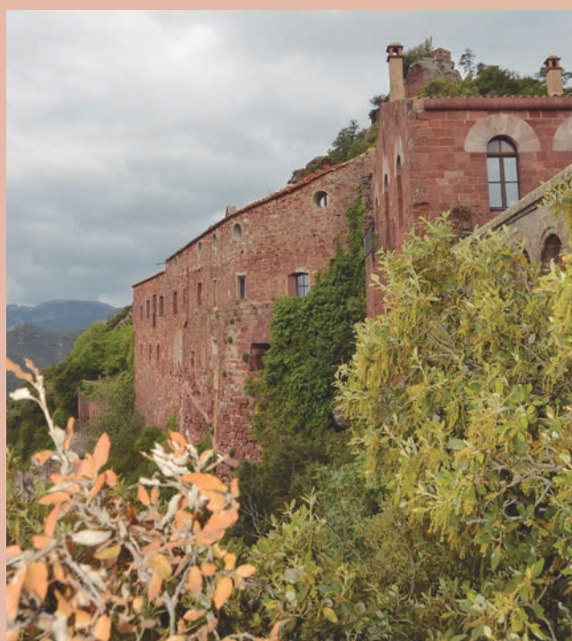
El Castell d'Escornalbou és un dels elements més atractius de la Costa Daurada.

Al voltant de la reforma hi gira el Projecte de recuperació i millora del Castell i de l'entorn de la Baronia de l'Escornalbou que es fa sota al paraigua dels fons FEDER 2014-2020. Generalitat i Diputació han creat una Comissió Mixta que és qui ha determinat com es vol que sigui aquest espai d'aquí a quatre o cinc anys. La voluntat és anar més enllà del que es marca amb el projecte subvencionat amb els FEDER, cercant també recursos per altres vies, per aconseguir que dels