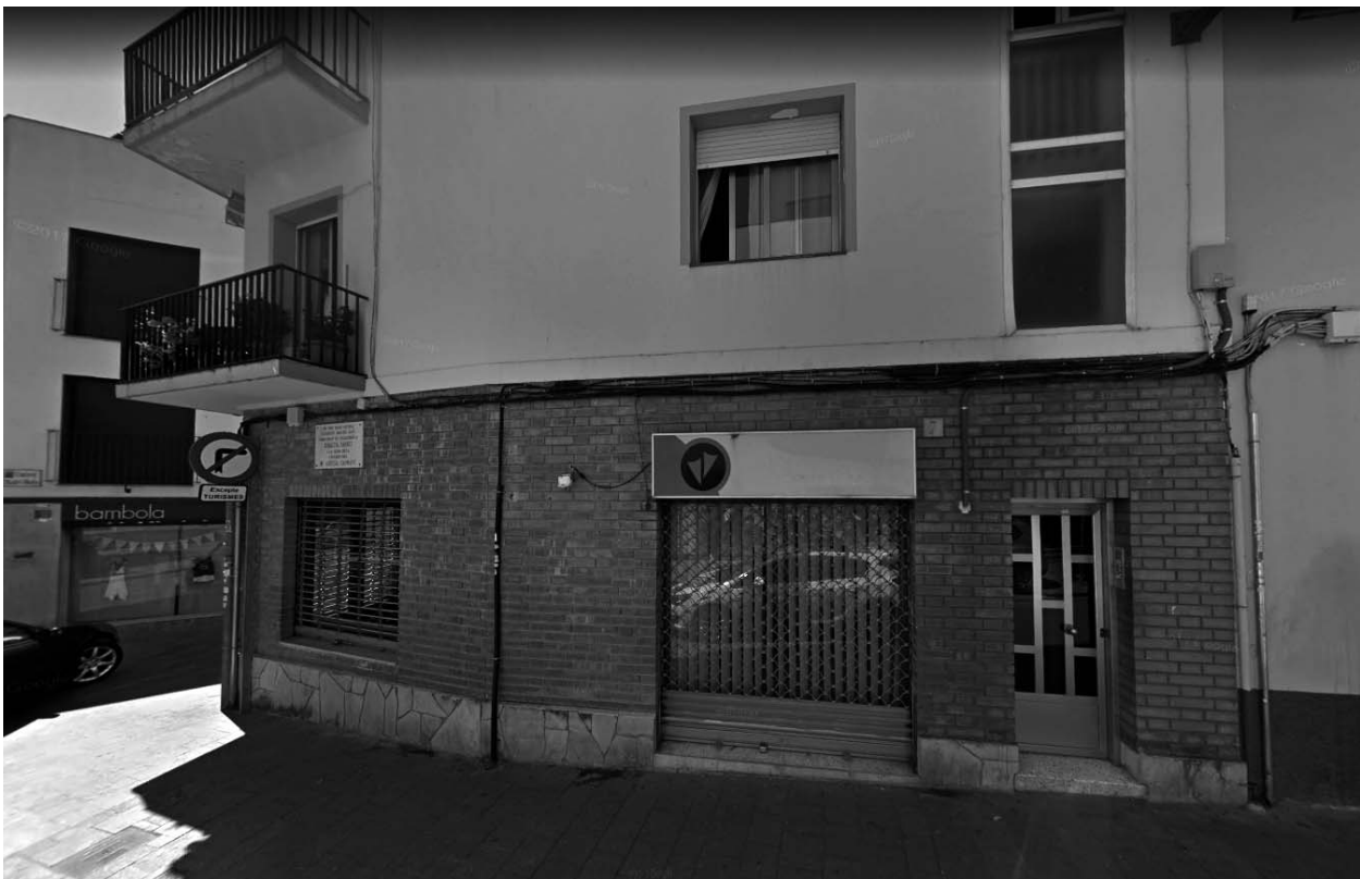
Cantonada en la qual hi havia l'entrada principal de Can Quirreta.