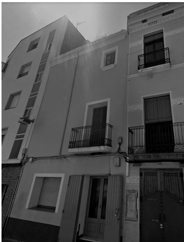
El que resta de Can Quirreta a l'actualitat.