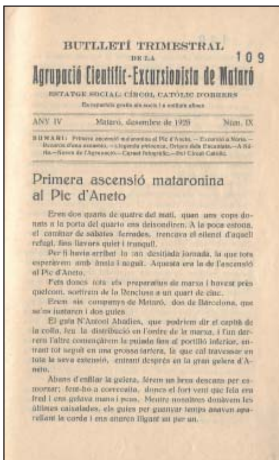
Crònica ascensió a l'Aneto