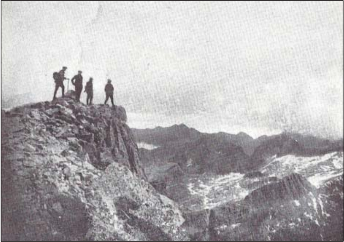
A dalt s'esplaien fent fotos a dojo...