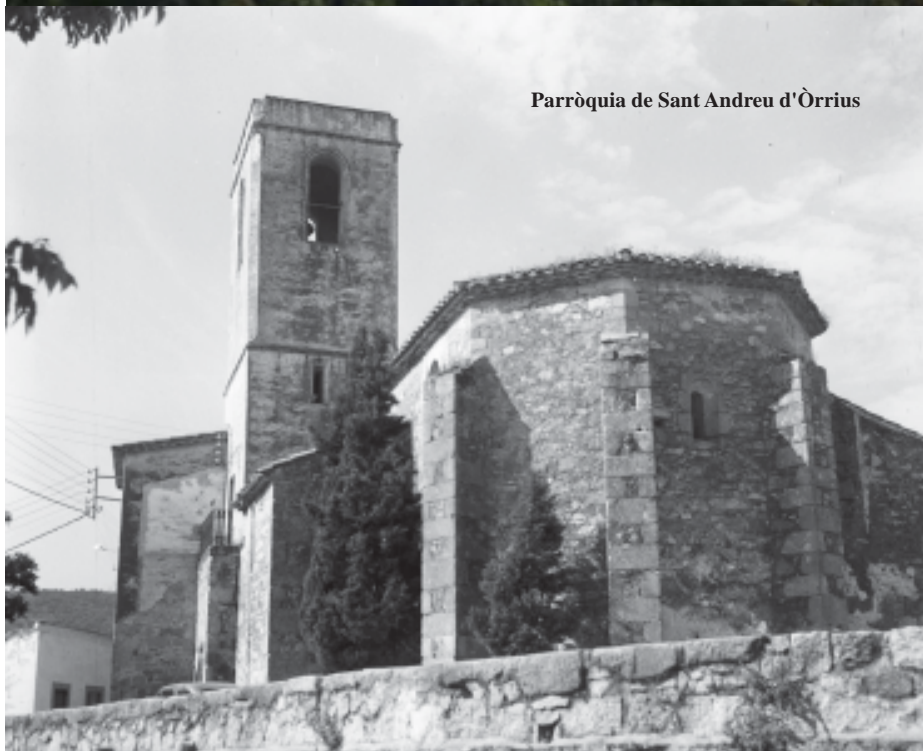
Parròquia de Sant Andreu d'Òrrius