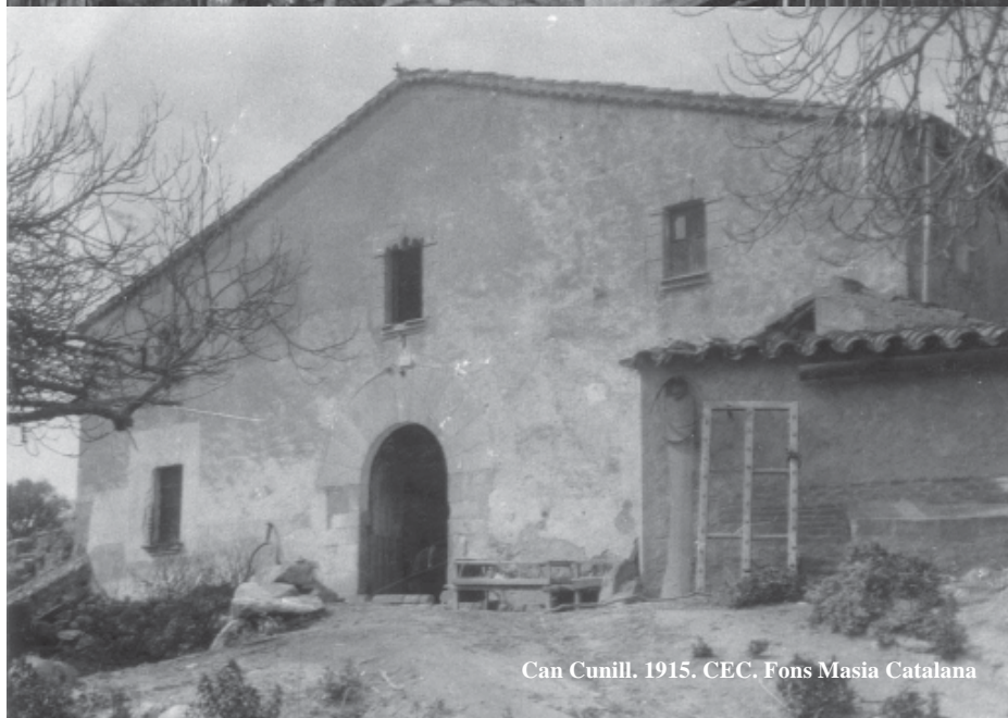
Can Cunill. 1915. CEC. Fons Masia Catalana