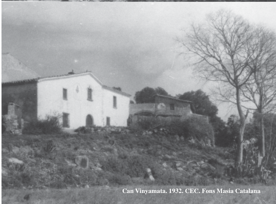
Can Vinyamata. 1932.