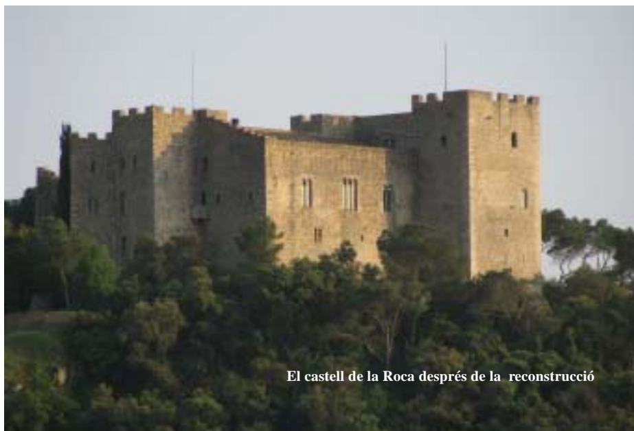
El castell de la Roca després de la reconstrucció