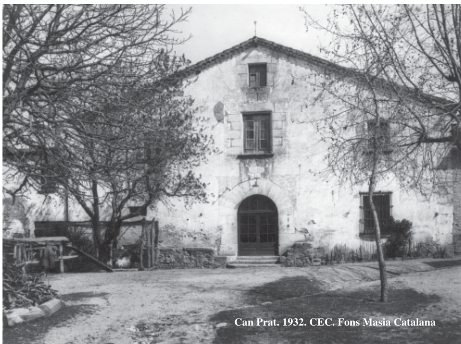
Can Prat. 1932.