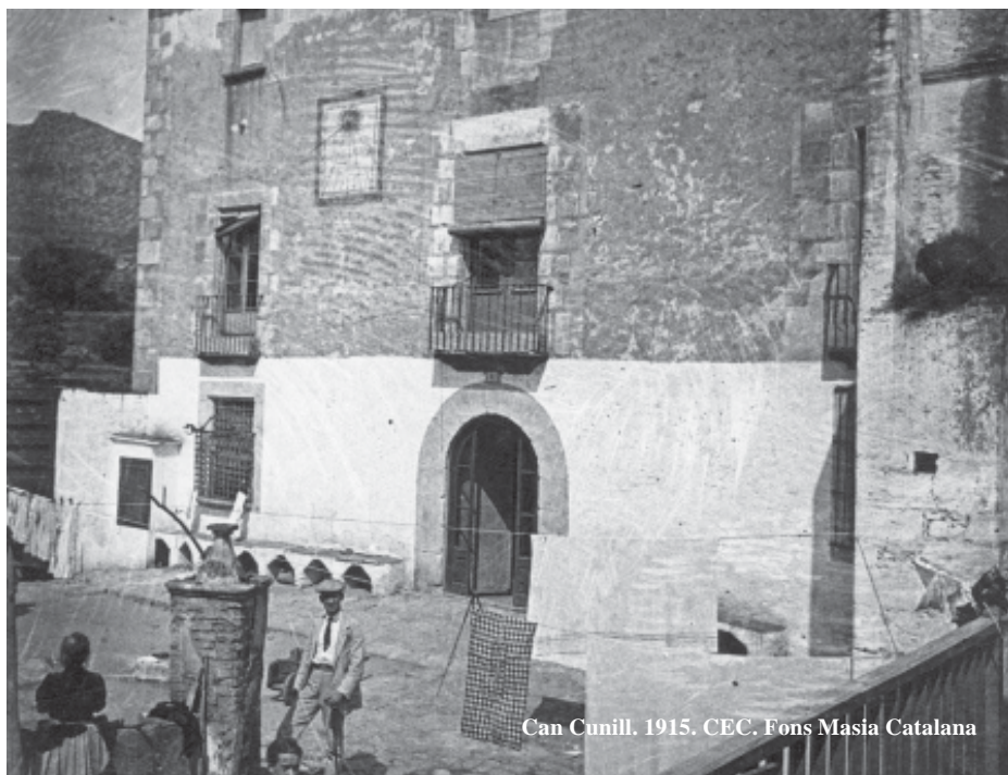
Can Cunill. 1915. CEC. Fons Masia Catalana