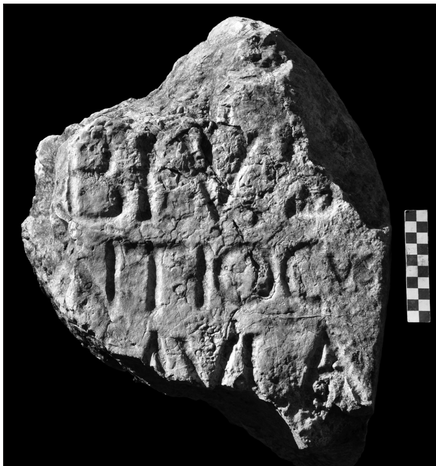
Fig. 3. Iscrizione n. 3

Frammento superiore destro di un cippo stonato di calcare (fig. 3), trovato a Castrocielo (FR), lungo il ciglio settentrionale della via Latina, circa m 365 a nord ovest