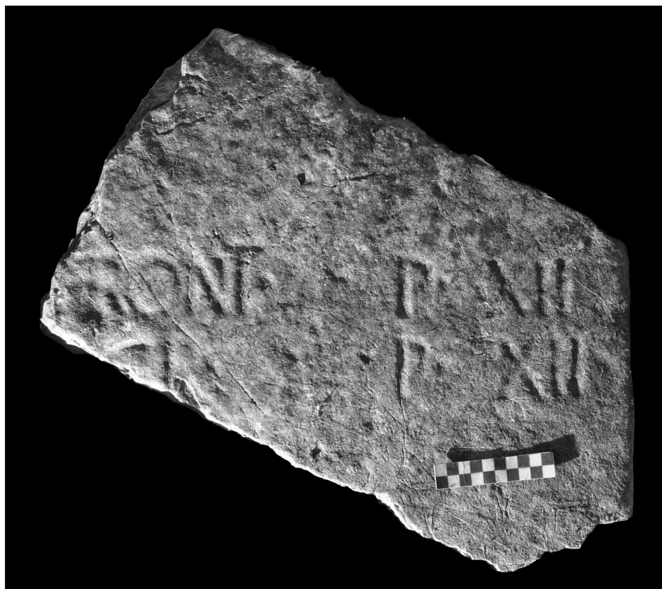
Fig. 4. Iscrizione n. 4

Grosso frammento di blocco calcareo iscritto (fig. 4), murato in un vecchio edificio in località «Granieri», in via Piscopagno, ad Esperia (FR) 29 . Il manufatto, utilizzato