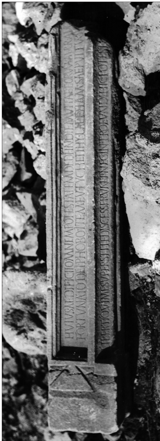
Fig. 1. Iscrizione n. 1