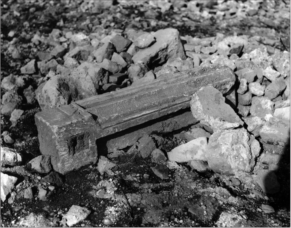
Fig. 1a. Iscrizione n. 1, parte inferiore

quanto, a parte la mancanza di indicazioni specifiche, essa riguarda sostanzialmente un contesto collinare che — alla luce delle nostre conoscenze sulla topografia antica della zona — difficilmente sembra adatto al tipo di edilizia monumentale postulata dai reperti 6 , che ci aspetteremmo piuttosto di trovare lungo la viabilità di fondovalle 7 . In ogni caso, resta comunque probabile che i reperti siano riconducibili alla zona di Patrica e quindi all'antico ager Frusinas .