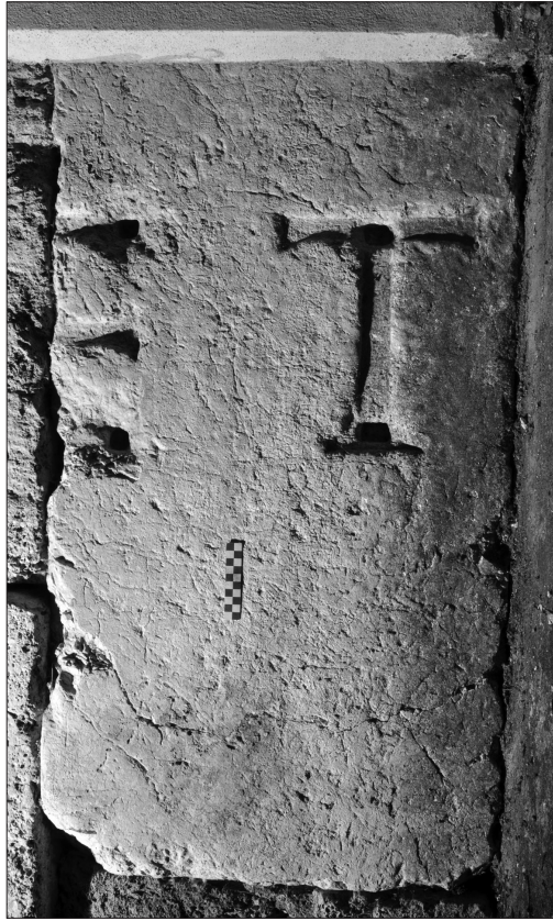
Fig. 5. Iscrizione n. 5

mentre la E pare fosse leggermente più alta 34 . I caratteri di metallo erano inseriti all'interno di alloggiamenti molto regolari (profondi intorno al centimetro), dentro i quali si trovano anche dei fori più profondi per i tenoni. Si legge: