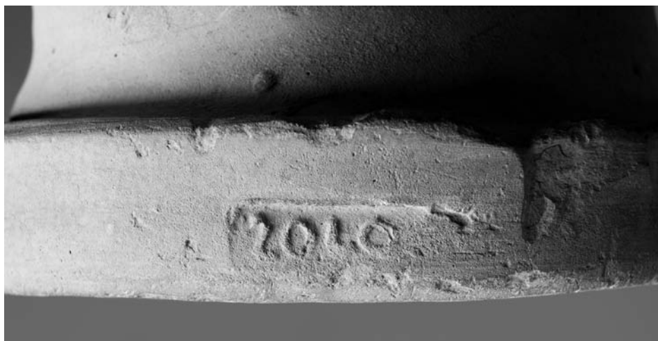
Fig. 2. Marchio SOLO su anfora del tipo Lamboglia 2 del museo di Amfipoli (archivio dell'Eforato di Serres)