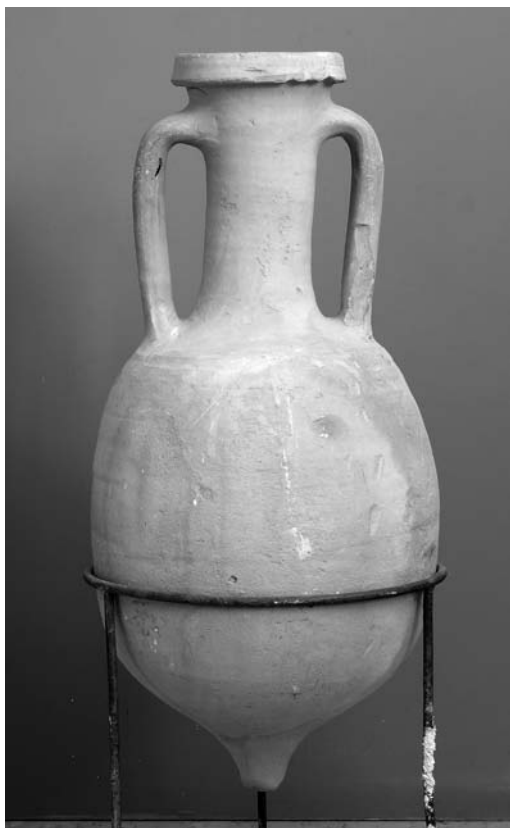
Fig. 3. Anfora del tipo Lamboglia 2 del museo di Amfipoli (archivio dell'Eforato di Serres)