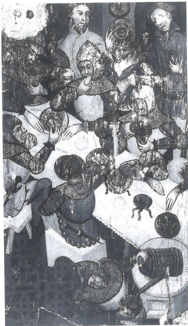
Banquet de guerrers, detall del retaule de Sant Martí Sescorts. Museu Episcopal de Vic.