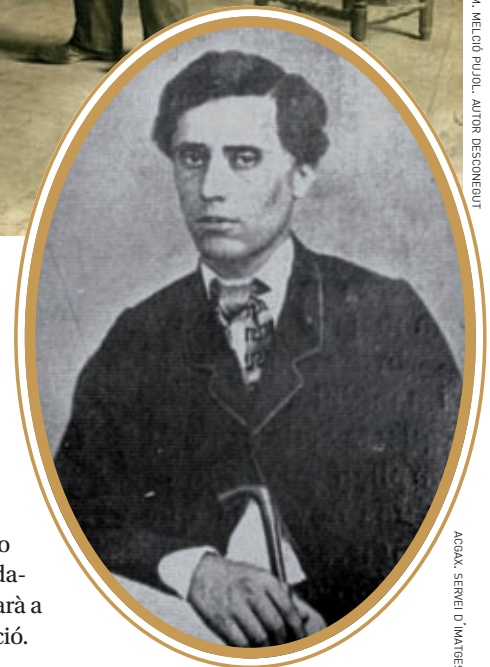
ACGAX. SERVEI D'IMATGES, ARXIU MEL

>> Curiosa i rara imatge de l'avi Berga, jove.