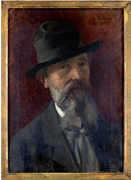
ACGAX. SERVEI D'IMATGES, ARXIU DOU