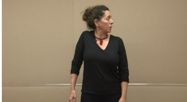
5.3. FIGURA 3