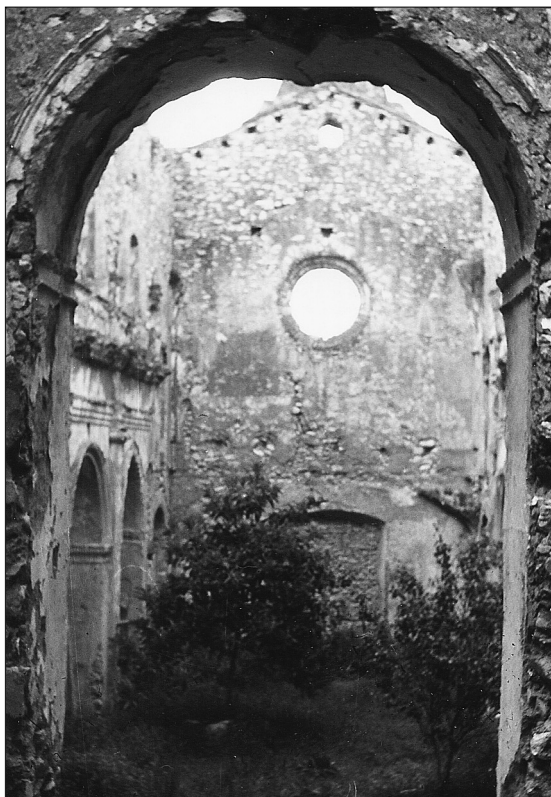
❑ Figura 1: Interior de l'església de Sant Llorenç del convent dels servites. Any 1971.

L'article d' El Vapor donava dues raons —les sanitàries i les urbanístiques— per traslladar el cementiri del costat de l'església parroquial cap al convent de Sant Llorenç. Tanmateix, van ser les circumstàncies de l'època —després de l'exclaustració del 1835— les que van provocar que l'església del convent de Sant Llorenç, dels religiosos servites, servís durant determinats períodes com a cementiri. Del 19 de juny del 1837 al 8 de novembre del 1837 hi eren soterrats 25 cadàvers, 7 a l'abril del 1839 dos, i tres més al juliol del 1840.