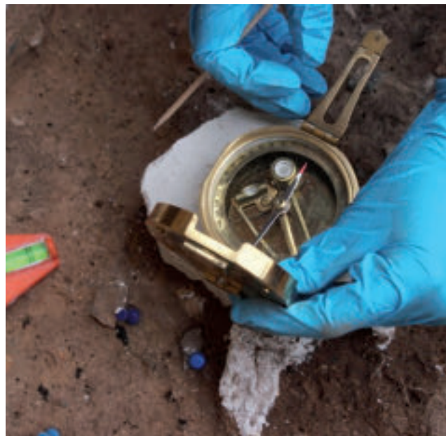
Figura 8. El Salt. Toma de muestras para el estudio arqueomagnético de los hogares.

Un avance clave en nuestras investigaciones ha sido la aproximación interdisciplinar al tiempo absoluto que separa un conjunto de 5 hogueras de la UE Xb de El Salt. Esto ha sido posible gracias a la integración de datos arqueostratigráficos de los materiales asociados a estos fuegos y de datos de arqueomagnetismo de estos mismos hogares, obtenidos a partir de bloques de sedimento intacto, es decir,