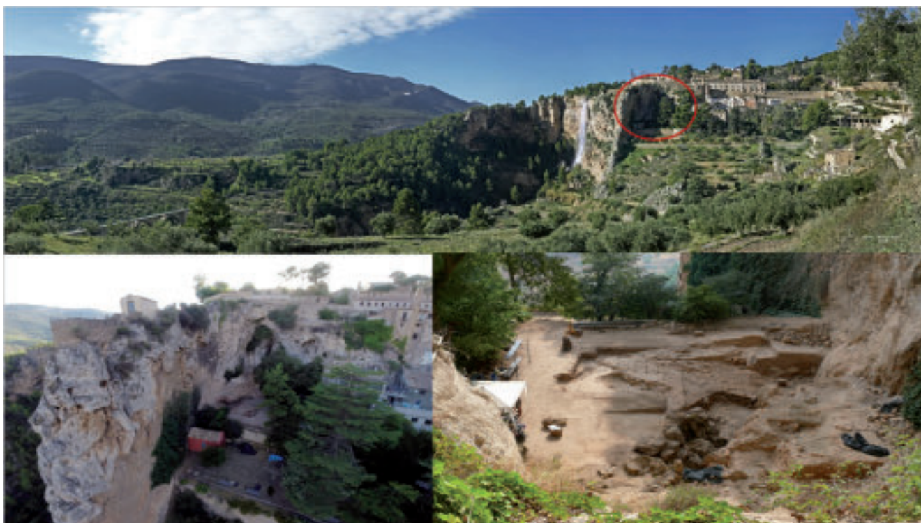
Figura 2. Panorámica general del emplazamiento de El Salt y área de excavación.

El depósito arqueosedimentario de este yacimiento comprende 6.3 m de espesor y fue estudiado inicialmente por Pilar Fumanal, quien distinguió 13 unidades litoestratigráficas (Fumanal, 1994) (fig. 3). Los trabajos posteriores han permitido profundizar en sus características y agrupar el conjunto en 5 segmentos, de acuerdo con sus rasgos texturales macroscópicos y con el contenido arqueológico. La descripción de cada uno de ellos se presenta a continuación, de base a techo: