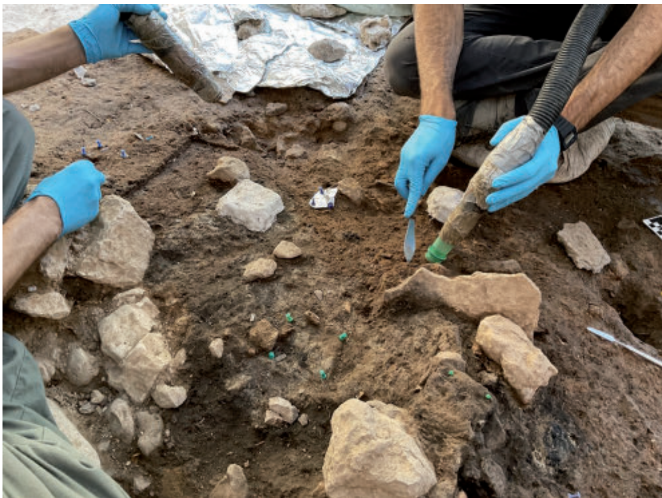
Figura 6. El Salt. Detalle del proceso de excavación en un área de combustión.

Por otra parte, los materiales arqueológicos son georreferenciados, así como los perímetros de las distintas facies