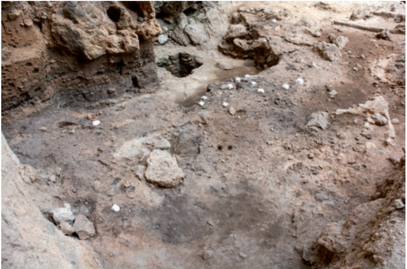
Figura 7. El Salt. Superficie de la UE XI. Se observa una densa superficie de combustión con las muestras para el estudio integrado de micromorfología y arqueomagnetismo.

El Salt y Abric del Pastor han destacado por ser contextos sedimentarios arqueológicos pioneros en los estudios de biomarcadores lipídicos, un campo cuyo potencial no se había explorado antes para cronologías tan antiguas. Con anterioridad a los mencionados estudios sobre las capas negras, en la UE X de El Salt se han llevado a cabo análisis exploratorios de sedimentos de hogueras que han aportado datos sobre las relaciones de aporte cárnico y vegetal a las hogueras a partir del análisis de residuos lipídicos (Sistiaga et al. , 2011), y es destacable el hallazgo de residuos moleculares y microscópicos de excremento humano (neandertal) cuya composición apunta hacia una dieta con una ingesta significativa de vegetales (Sistiaga et al. , 2014). En