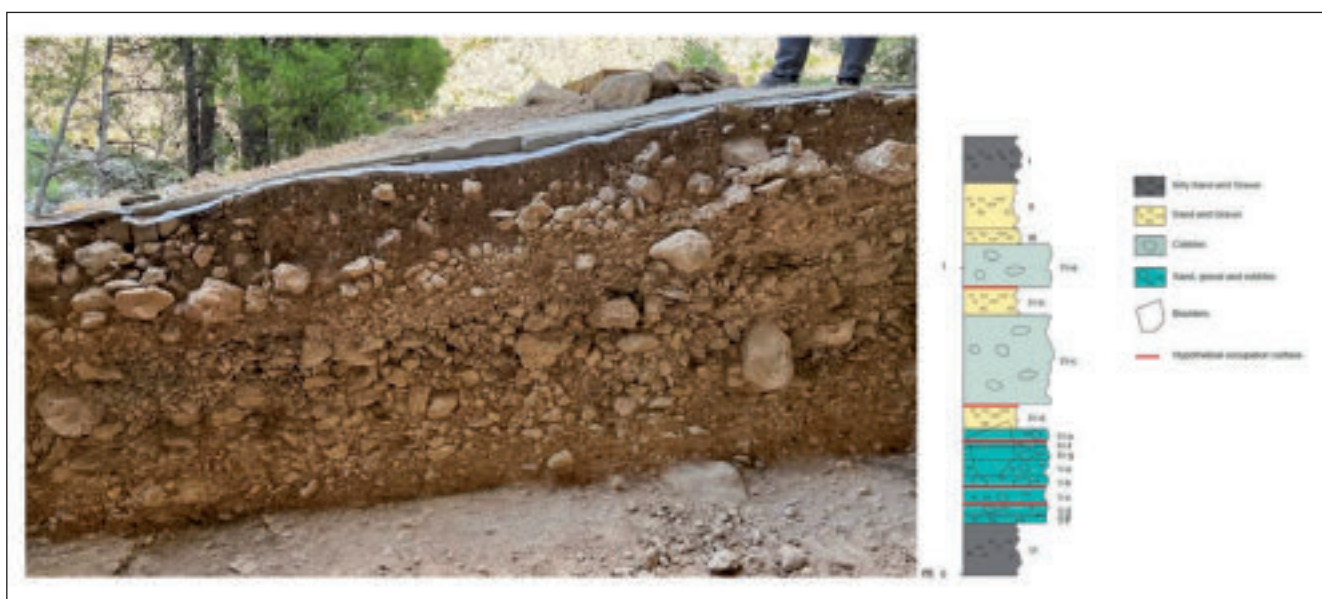
Figura 5. Depósito y esquema estratigráfico de Abric del Pastor.

- UE II: corresponde a un sedimento relicto en el sector NW del área excavada, truncado por UE-I. Exhibe una potencia entre los 8 y los 13 cm. Su matriz calcítica, cementada en algunas zonas, también contiene abundantes cavidades de disolución y muestra un aspecto pulverulento, debido a la