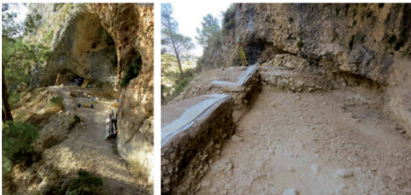
Figura 4. Abric del Pastor. Visión general del abrigo y del área de excavación.

sector occidental del abrigo, se acumularon los restos de un desplome masivo de esta zona de la cubierta, que debía configurar una pequeña covacha interior. Este desplome supuso una importante reconfiguración de la superficie útil en el Abric del Pastor. Contiene evidencias de varias ocupaciones con una reducida proporción de testimonios de combustión.