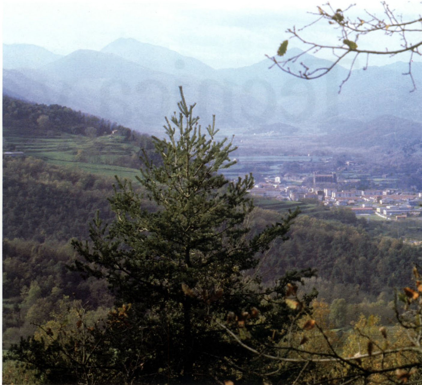
Foto 1: El municipi de Sant Joan les Fonts, juntament amb els termes d'Olot i de Castellfollit de la Roca (amb els quals delimita a ponent el Parc), forma part del nucli més industrialitzat de la comarca garrotxina

E l present article tracta la problemàtica plantejada pel creixement urbà en una zona natural protegida com és el Parc Natural de la Zona Volcànica de la Garrotxa. Aquest fou l'objecte d'estudi del Campus Europeu de Medi Ambient que va tenir lloc a Olot del 15 d'agost al 30 d'octubre de 1991. Aquest Campus es va realitzar sota el patrocini de la Direcció General de Medi Ambient (DG XI) de la Comissió de les Comunitats Europees i amb el recolzament del Consell Comarcal de la Garrotxa i del Parc Natural de la Zona Volcànica de la Garrotxa.