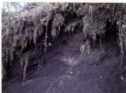
Foto 3: L'elevat nombre de volcans localitzat a la regió volcànica d'Olot (quaranta, aproximadament) dóna lloc a la formació d'un sòl força característic