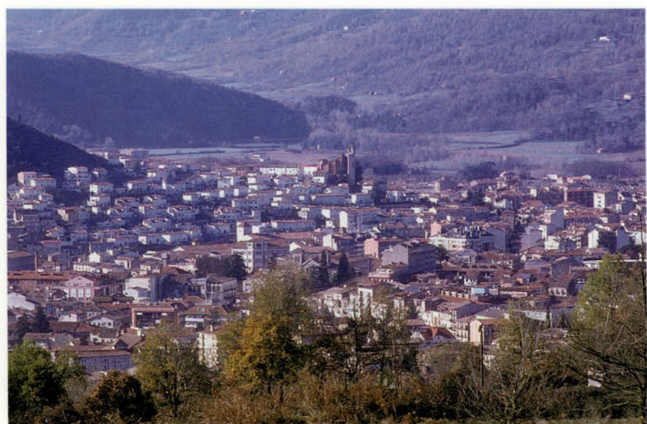
Foto 5: La ciutat d'Olot, a la vall del Fluvià, és el centre de serveis i nucli industrial més important de la Garrotxa

El cràter del volcà de Santa Margarida és un dels més ben conservats a la comarca garrotxina, a més de ser dels més bells