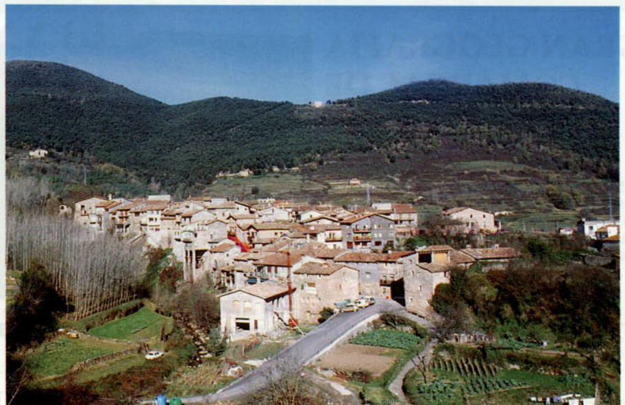
Foto 9: Vista general del poble de Riudaura, situat a l'extrem occidental de la comarca

Això ens mostra que no hi ha cap impediment per a ordenar territorialment la comarca en funció de l'"espai protegit" i respectant els interessos compatibles amb la seva conservació i, en el cas del Parc Natural, permetre un aprofitament econòmic integrat i sostingut amb les directrius de