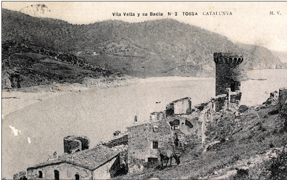
Vila Vella amb la Torre d'en Joanàs al fons la primera dècada del s. XX.