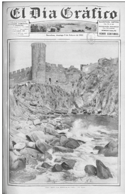
Portada de El Dia Gráfico, de 5 de febrer de 1933, amb la imatge de la muralla del Codolar, de Tossa.