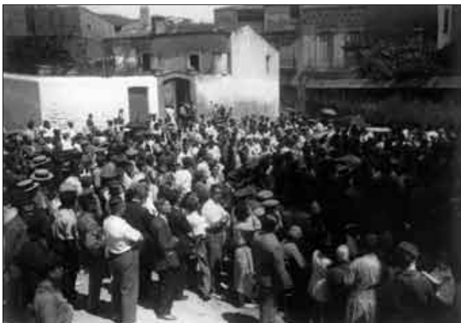
Imatge 7. Parlaments a la plaça de l'Església.