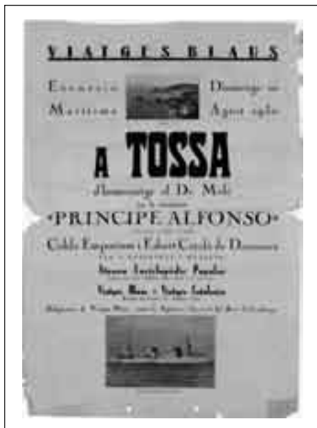
Imatge 2. Full volader de l'homenatge al Dr. Melé amb el suport de Viatges Blaus.