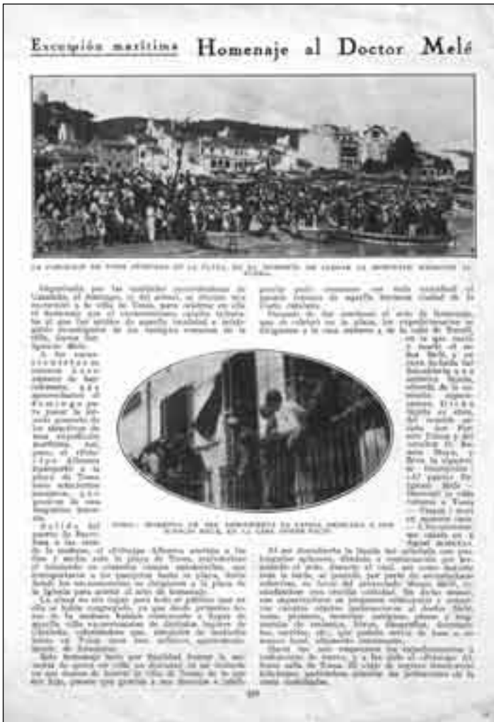
Imatge 10. Crònica de la diada apareguda a La Publicitat.