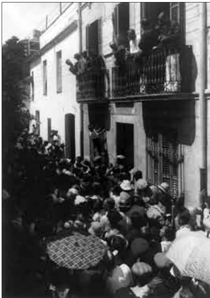
Imatge 9. Descobriments de la làpida commemorativa del Dr. Ignasi Melé

A les 12.00 h tingué lloc la desfilada dels concurrents per veure la làpida i la posterior visita als mosaics romans dels Ametllers, al Museu i a la Vila Vella. La gernació es va dispersar a les 13.00 h per dinar a la costa i la muntanya o bé a les fondes de la vila, mentre alguns varen decidir fer un mos al mateix vaixell.