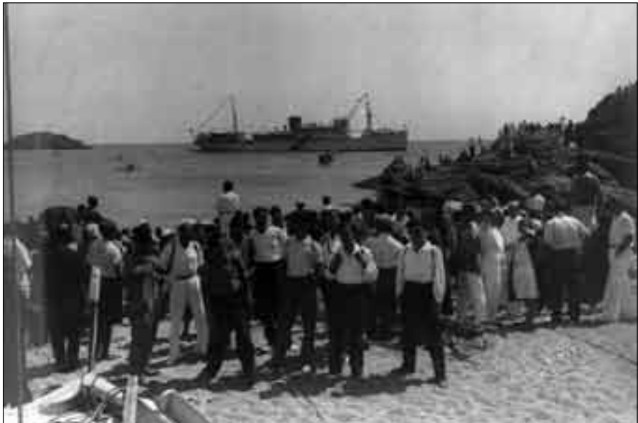
Imatge 4. Rebuda dels excursionistes a la platja de Tossa.

A les 9.45-10.00 h s'arribà a la badia de Tossa, on els expedicionaris foren desembarcats amb canots (barques a motor). Els encarregats de fer-ho lluíen un distintiu de color verd en el trauc de l'americana o bé un braçal. A la platja foren rebuts pels nens i nenes de la colònia escolar Turissa de l'Ajuntament de Barcelona, dirigida pel Sr. Artur Martorell, i molta gent del poble, així com també estiuiejants i excursionistes barcelonins i gironins vinguts amb cotxes, autocars o a peu. Durant el dia tingué lloc una postulació per senyorettes de Tossa i Barcelona, destinada a la construcció del nou Museu Melé.