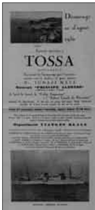
Imatge 3. Cartell detallat de l'homenatge al Dr. Melé amb el suport de Viatges Blaus.