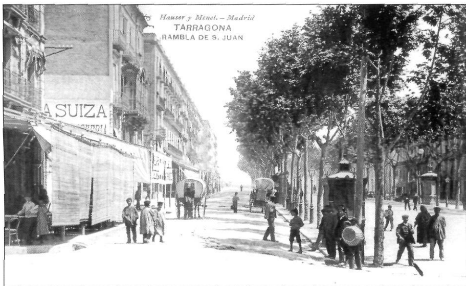
Antiga Rambla de Sant Joan, avui Rambla Nova a inicis del segle XX. Arxiu autors.