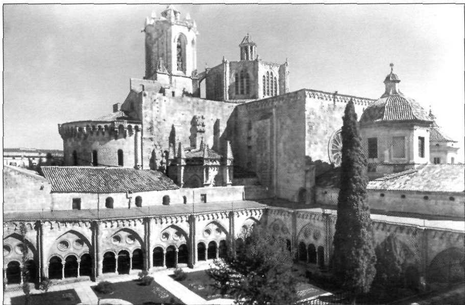
Vista de la catedral de Tarragona símbol de la capitalitat religiosa de la ciutat.