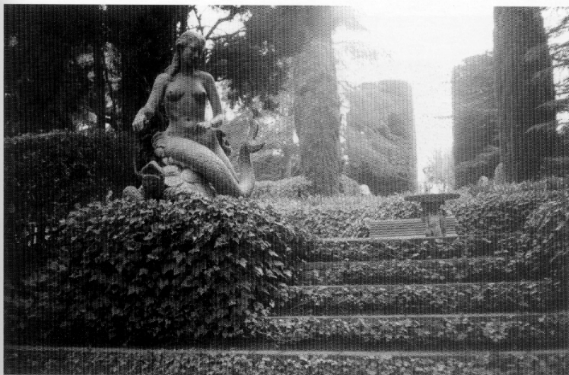
Escalinata que condueix a la plaça més monumental dels Jardins, on trobem dues impressionants petxines de mida descomunal. El conjunt escultòric de sirenes és obra de l'escultora Maria Llimona.