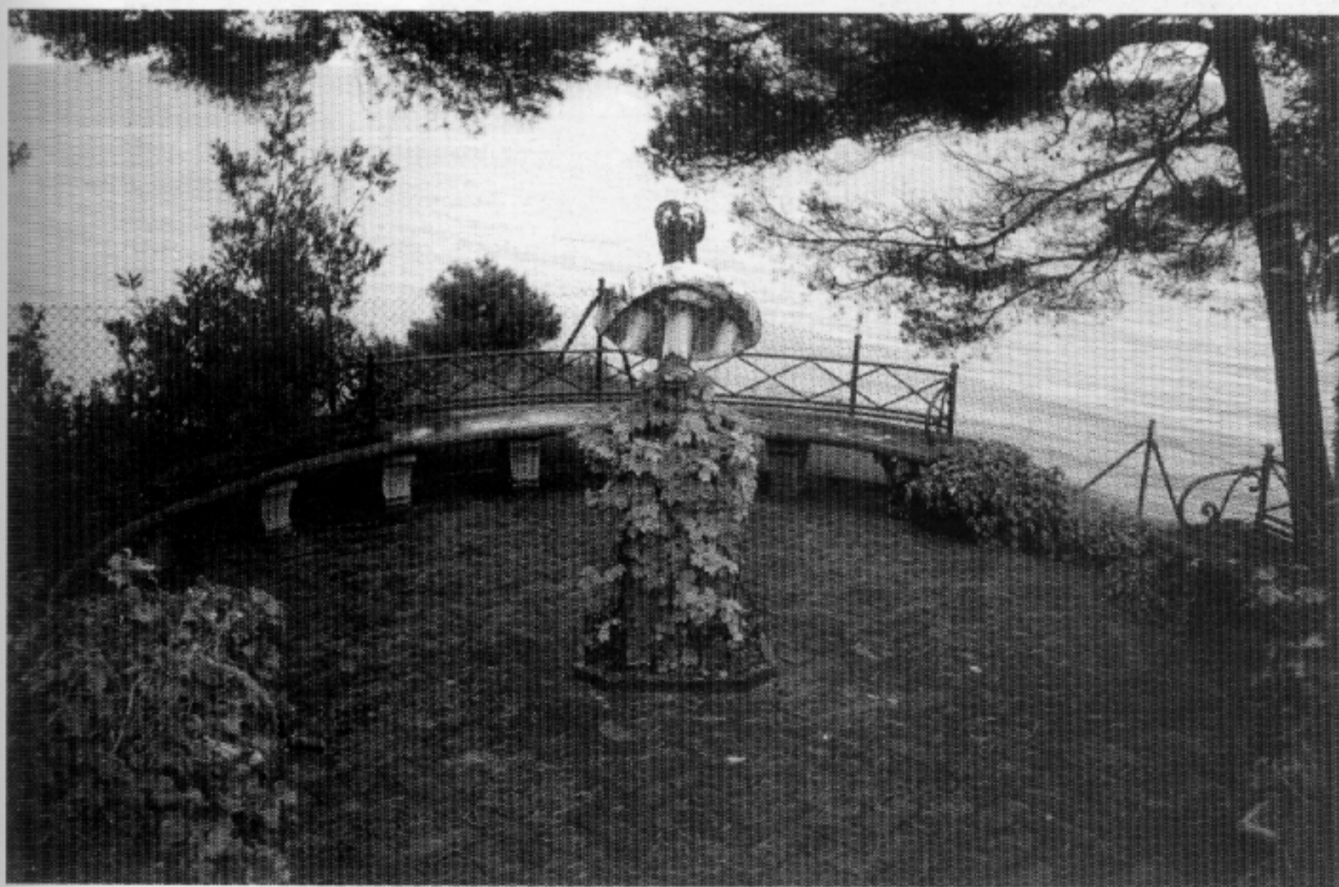
La projecció del Jardí centra els ulls del visitant en diferents focus d'interès paisatgístics presidits per sengles estàtues d'inspiració clarament romana.