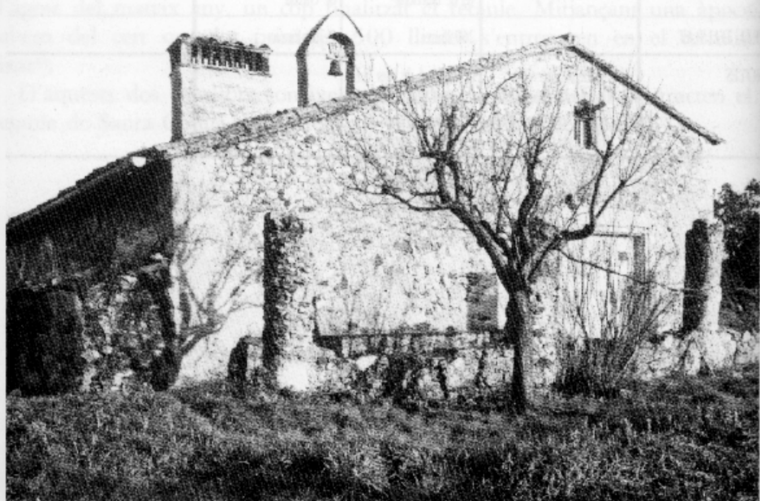
Capella de Sant Llorenç (Llagostera).