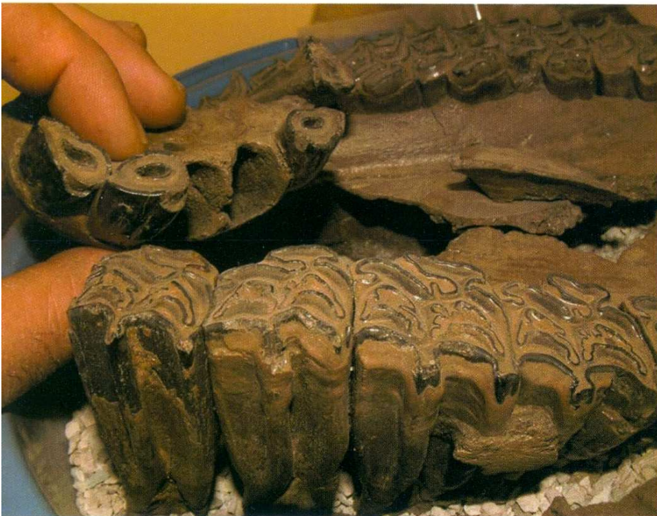
Figura 1: Molars de cavall ( Equus stenonis ).

romana, l'any 139 aC. Però les primeres manifestacions de poblament les trobem en els enterraments de can Misser, que són de l'Edat del Ferro. A la riba esquerra de la riera de Vallparadís, l'any 1110 Ramon Berenguer III va permetre la construcció d'una nova fortalesa al municipi. Aquesta, el 1344, per donació de la família dels Centelles, va ser convertida en la Cartoixa de Vallparadís, solemne monument romànic que