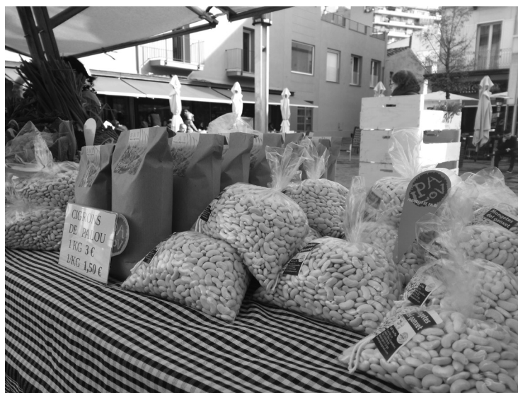
Productes de Palou en el mercat del dissabte de Granollers. gener 2017.

L'augment dels productes locals i ecològics és una mostra d'un canvi de tendència, tant des de la producció com des del consum. Nous perfils de pagesos i pageses agafen les regnes de les explotacions agràries i nous perfils de persones estan interessades a consumir aquest tipus de productes. El consum de proximitat és el ressorgiment i la revaloració de la producció agroalimentària vinculada a la terra i allunyada de l'homogeneïtzació productivista de l'agricultura convencional. Fruit d'aquesta emergència són els diversos projectes de recuperació de varietats i receptes tradicionals, així com productors i elaboradors centrats a fer un producte de qualitat.