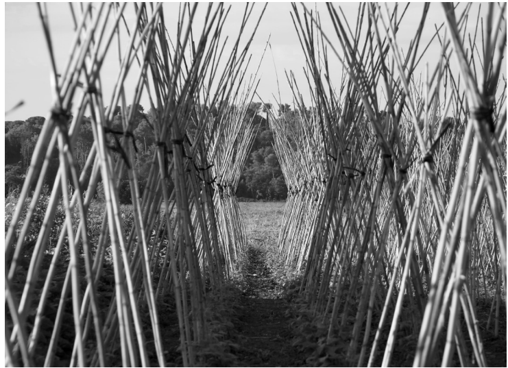
Conreu de varietats locals de mongeta a l'Ametlla del Vallès. agost 2014.

Per la seva banda, també s'ha publicat recentment la Guia documental dels productes del Vallès Oriental , editada per les biblioteques de Granollers, una síntesi dels principals productes agrícoles basada en la tradició mediterrània de la comarca, vinculada al cereal, l'oliva i la vinya. A més a més, s'identifiquen els productes agroalimentaris més característics, com són els llegums, l'horta i la fruita. En aquesta publicació es parla dels productes en general sense especificar cadascun dels productors, tal com es fa en el Catàleg de Productors Artesans del Vallès Oriental.