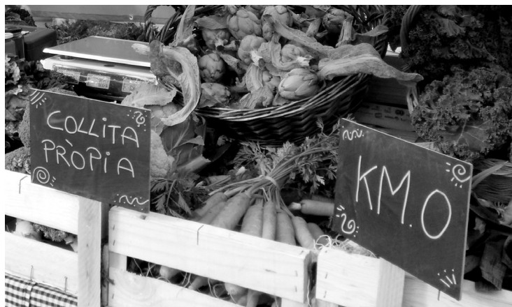
Detall del mercat del dissabte a la plaça de la Corona de Granollers, amb productors locals i ecològics de l'espai rural de la Granollers agropolitana. Fotografia: Neus Monllor, gener 2017.

Pel que fa al Pla Estratègic de Palou, el document descriu les principals línies de treball per tal de fomentar l'espai agrari granollerí, així com el consum d'aliments saludables a la ciutat. De les accions que s'hi recullen, algunes ja s'han portat a terme, com per exemple la creació de la marca de qualitat Productes de Palou, la participació en el projecte de banc de llavors locals o la creació del mercat de proximitat, i d'altres estan pendents d'execució, com ara la incubadora de projectes agraris, la facilitació de l'accés a la terra o el desenvolupament d'esdeveniments a Palou amb repercussions exteriors.