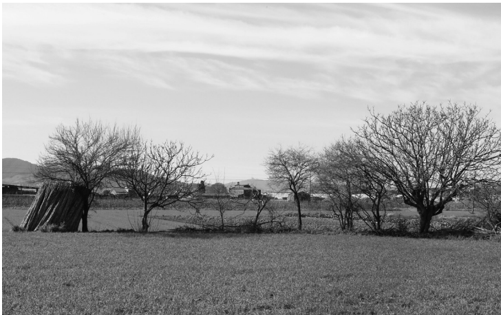
Paratge rural de Palou, l'espai rururbà de la Granollers agropolitana. Fotografia: Vicenç Planas, març 2013.

Ponències Revista del Centre d'Estudis de Granollers, 21 (2017), 89-120