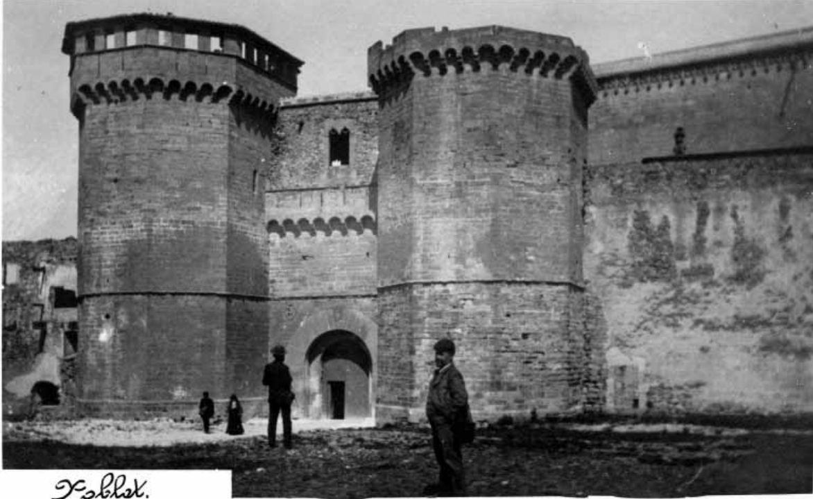
Portal d'entrada al monestir de Poblet. Postal fotogràfica d'autor anònim dels primers anys del segle XX.

más libre que no él, y marchando de una hacienda a otra cada día conoceré no nuevos superiores que me manden ni molesten con sola su presencia sino nuevos vasallos que todos formarán competencia en servirme, en darme pruebas de fidelidad, en regalarme y obsequiarme presentándome las mejores frutas, panes, vinos, gal[.]inas, pollos y perdices que tengan. Yo, tratando con alguna concideración y humanidad ha aquellos colonos, administradores y colectores de los patrimonios de aquel monasterio, seré tanto y más que ningún rey”.