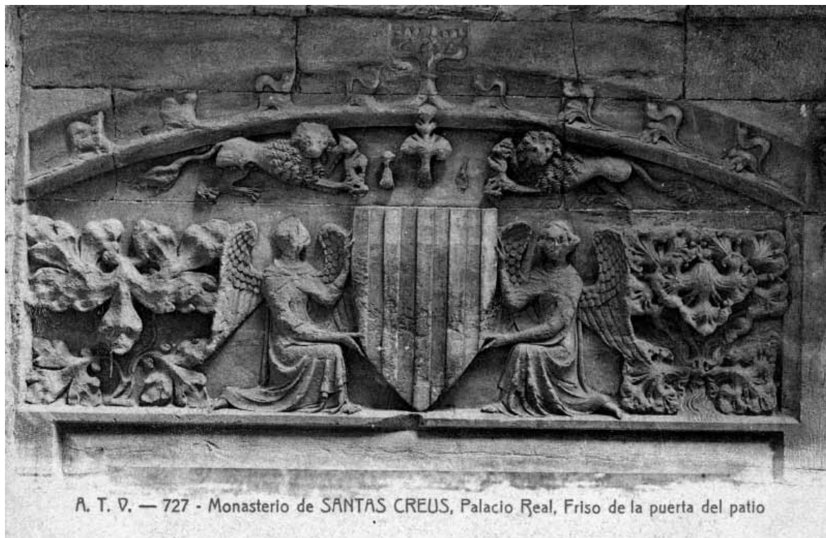
Monestir de Santes Creus. Detall escultòric segons una postal editada per Àngel Toldrà Viazo.

Y con dichos pactos y no sin ellos hase dicho señor apoderado el presente arrendamiento, cediendo y transferiendo al arrendatario y a los suyos todos los derechos y acciones del citado monasterio y administración que representa competentes, en virtud de los cuales puedan percibir y cobrar las cosas con el presente arrendadas del mismo modo que el monasterio y superioridad arriba indicada las cobraría en caso de no quedar con el presente arrendadas, firmando épocas y recibos de cuanto percibieren y cobraren, hacer y obrar cuanto ejecutar podría el propio real monasterio y administración judicial y extrajudicialmente antes de este arriendo, con constitución de procurador al objeto como en cosa propria y con las demás cláusulas útiles y necesarias.