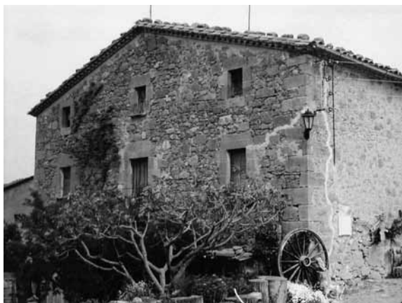
Casa Falou (Llobera).

primers enclavaments militars que genera la conquesta musulmana i que s'intercalen entre les ciutats antigues, s'associen al terme àrab qal'a , d'on s'origina el nom de la població de Calaf 25 que, en època emiral, degué ser el centre territorial de l'Alta Segarra, on també devia estar inclòs l'actual municipi de la Molsosa i el Palà que aquí ens ocupa.