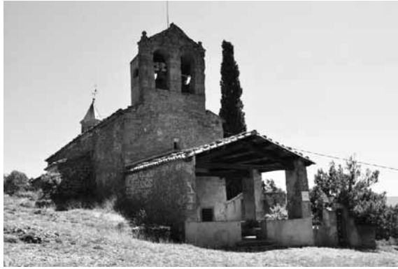
Santuari de Massarrúbies (Lladurs).

relació als resultants de Maxa- i Sama-, cal dir que aquests no es documenten al Solsonès.