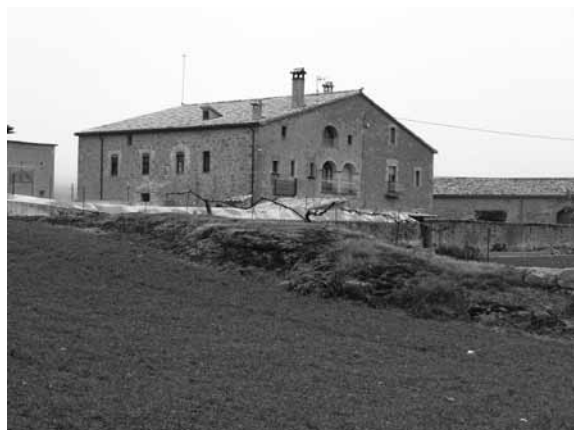
Hostal de Cirera (Lladurs).

959. Aquesta Cirera, a Lladurs, de fet és el nom d'un alou ben documentat ja al segle X que ha donat nom a aquestes diverses cases i a un hostal i, a Cirera hi trobem Sant Miquel de l'Alzina (IPAC 3808), també coneguda com Sant Miquel de l'Alzina del Pla de Cirera, Sant Miquel del Pla de Cirera, i Sant Miquel de la "villa Paliariensi", localitzada prop de la caseta de l'Alzina, al cim d'un petit turó dedicat a Sant Miquel que es troba documentada des del segle XI (CR XIII: 58).