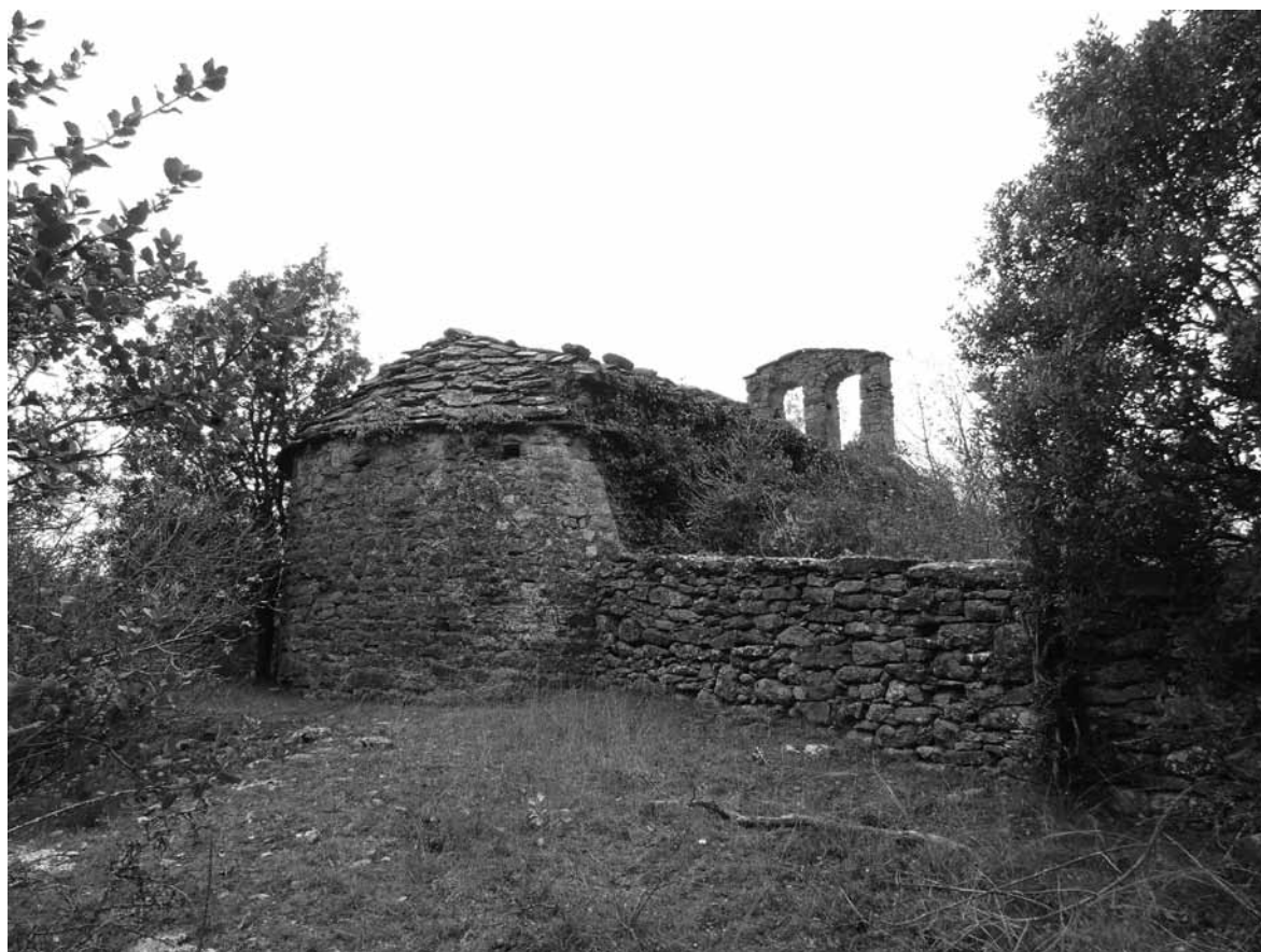
Sant Agustí d'Isanta (Lladurs).

En aquest context cal fer un seguit de reflexions, la primera d'elles referides a les necròpolis, especialment a aquelles que corresponen a tombes fetes amb caixes de lloses de secció quadrangular, molt presents a la comarca del Solsonès, ja que la datació d'aquestes pot portar força problemes interpretatius si els criteris són exclusivament tipològics, atès que aquestes datacions poden ballar del segle VI-VII al XII, tal i com s'ha pogut constatar recentment en el cas de la tomba d'Isanta on la datació realitzada a partir de la tipologia li assignava una cronologia del segle XII, mentre que la datació per C-14 li assignava un context cronològic del segle VI-VII (Aguelo 2013 i en premsa). La datació donada per la tipologia permetia relacionar aquesta tomba amb un espai de sagrera de l'església de Sant Agustí d'Isanta, mentre que la datació d'aquesta tomba al segle VI-VII feia replantejar la interpretació en no haver-se institucionalitzat encara aquests espais de sagrera en aquest context