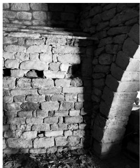
Restes de Sant Pere del Cavall (l'altre sufragània dels Torrents) visibles a l'interior del mas Cavall