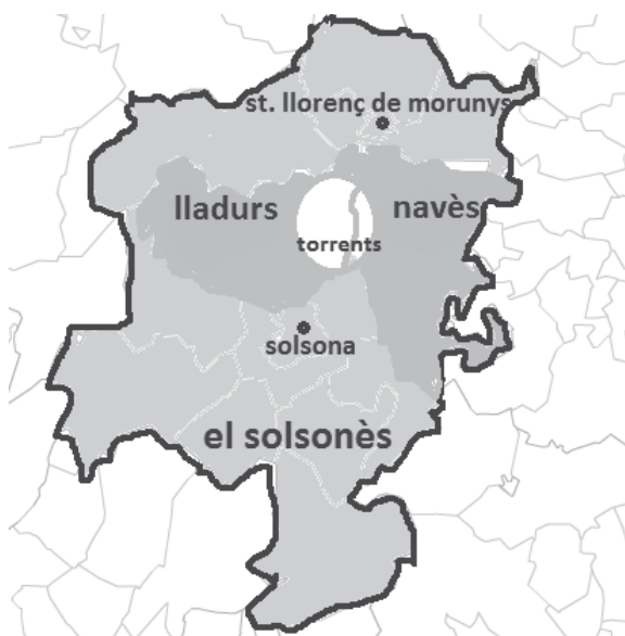
Situació del terme parroquial dels Torrents, a la comarca del solsonès

capbreus (1501, 1570 i 1626) conservats a diferents arxius de la comarca 4 .