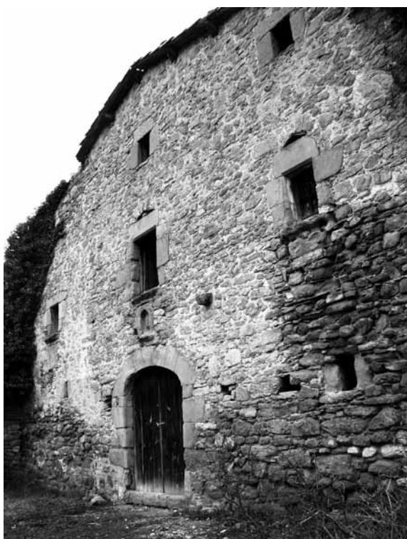
El mas Olivelles