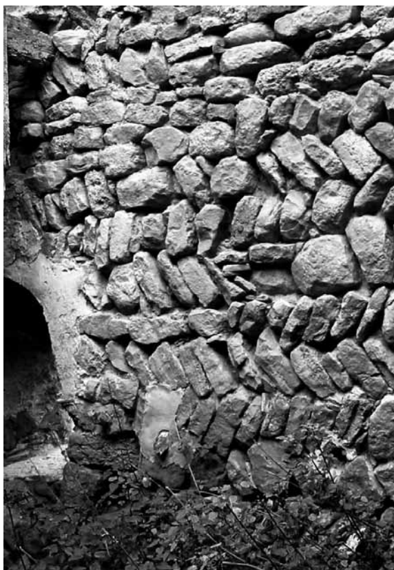
Mur d' opus spicatum al mas Peà