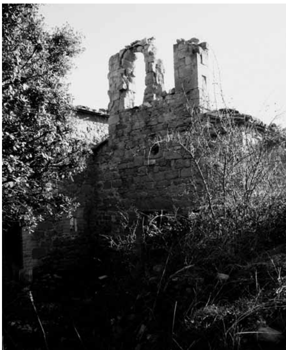
Sant Jaume de Peà (sufragània dels Torrents)

Pel que fa a l'església sufragània de Sant Pere del Cavall, era llavors una petita construcció romànica, l'àmbit de la qual quedà travessat per la nova construïda el 1766. El temple, si bé petit pel que fa a dimensió, contenia un interessant retaule policromat d'autor desconegut dedicat a Sant Pere, avui dia conservat al Museu Diocesà de Solsona (MDCS)