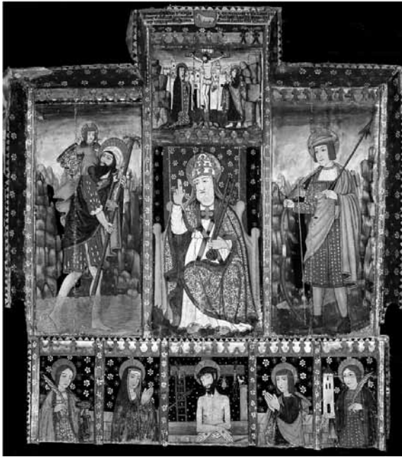
Retaule de Sant Pere. Mestre del Cavall. MDCS 36.

utilitzat per a assemblees de veïns. Així era doncs, al segle XVII, el punt central del terme parroquial del Torrents.