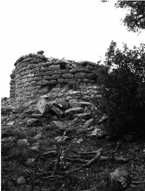
Restes de l'àbsis de Sant Jaume de Torrentoller