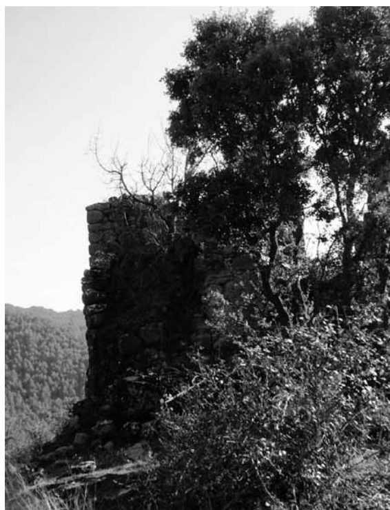
Restes del mas Castelló