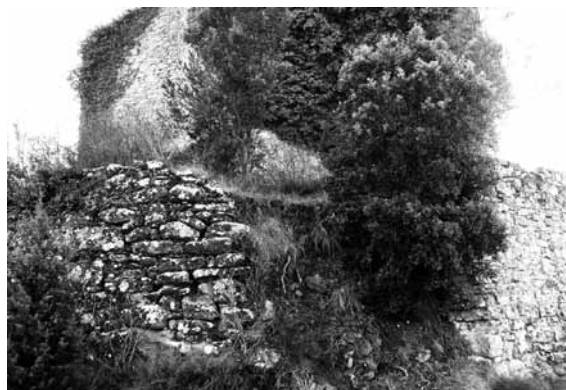
Mur nord del fossar