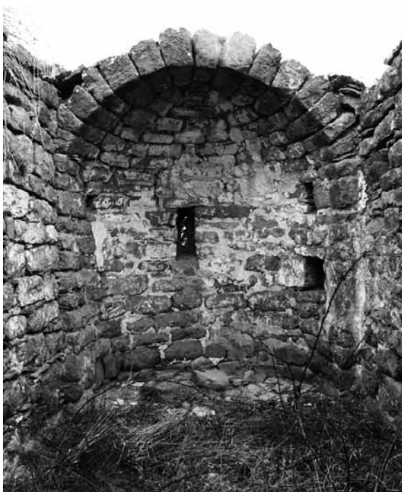
Sant Pere de Capdevila

de dita parroquial iglésia de els Torrents que vuy se troba, y tornar-la a edificar de nou.... podent-se est servir y usar de la deferra de la pedra y tosca de la iglésia vella que serà bona per obrar... 23 , frases que