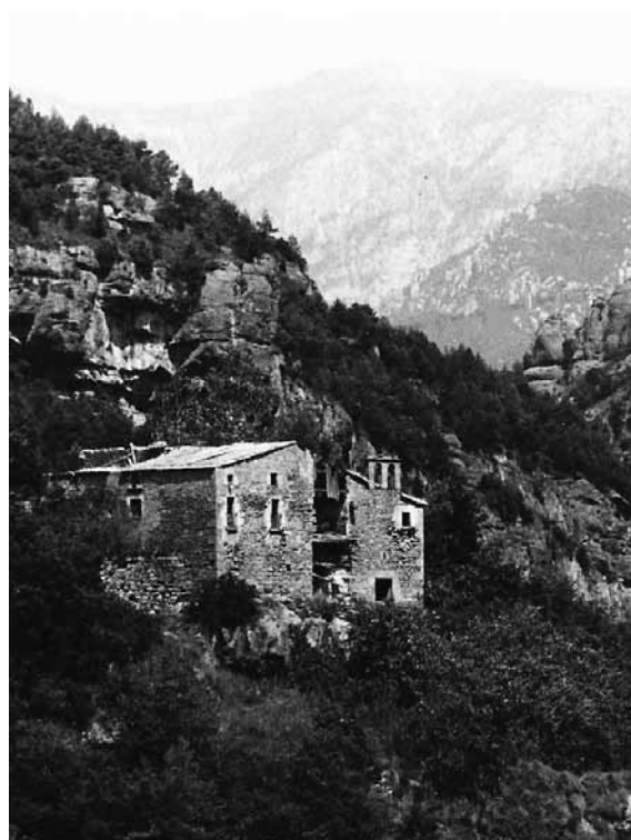
El mas del Cavall (fotografia de1978)