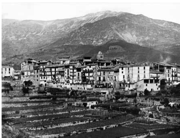
Vila de Sant Llorenç de Morunys, 1923