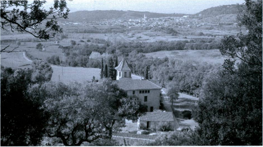
La Granoia i la vila de Moità, al fons