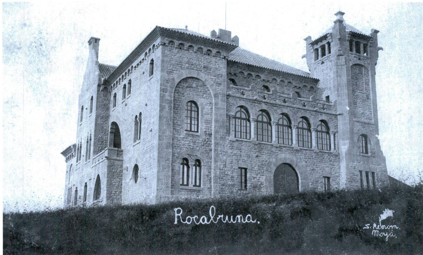
L'actual casa de Rocabruna, en una fotografia de la dècada de 1920