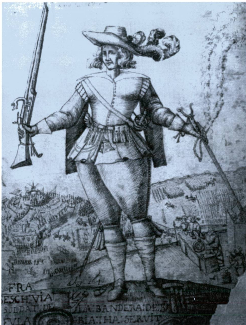
Soldat del segle XVII, amb arcabús i forqueta