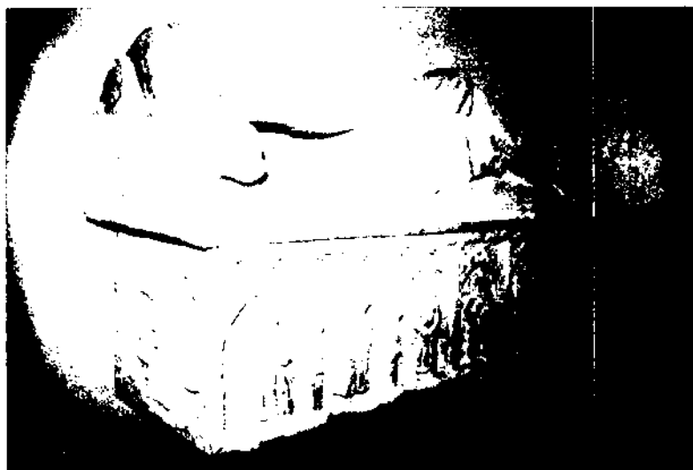
Conegut sarcòfag de Bernat de Tous, servat a l'església parroquial de Sant Martí de Tous. S'observa la magnífica realització de l'estàtua jaçant que hi ha damunt la tapa, així com també la caixa profusament treballada per tres dels seus costats, amb planyideres dins nínxols gòtics.