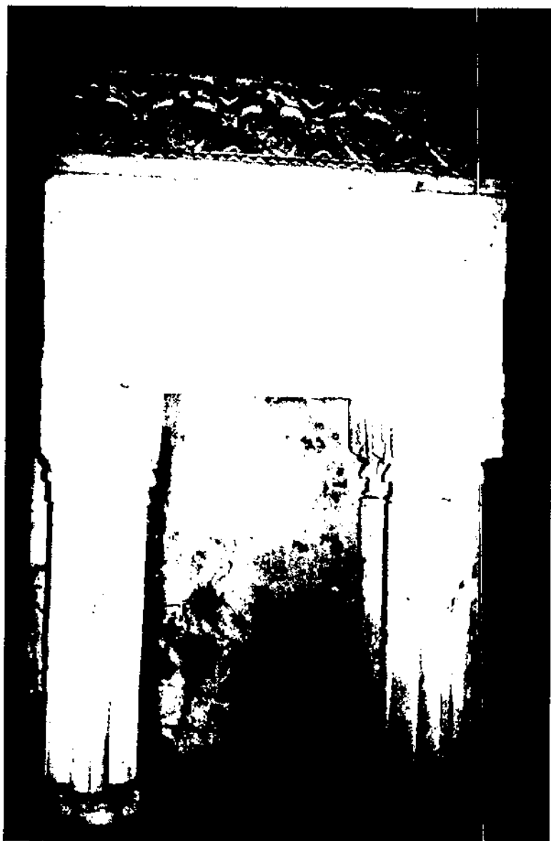
Bonic sarcòfag existent a l'ex-priorat benedictí de Santa Maria de Banyeres, que consta d'una caixa i tapa, profusament decorat amb escuts heràldics amb la mateixa càrrega. L'aguanten quatre columnes de gran solidesa. Se suposa que pertany a un membre de la nissaga dels Banyeres, benefactor de l'indret.