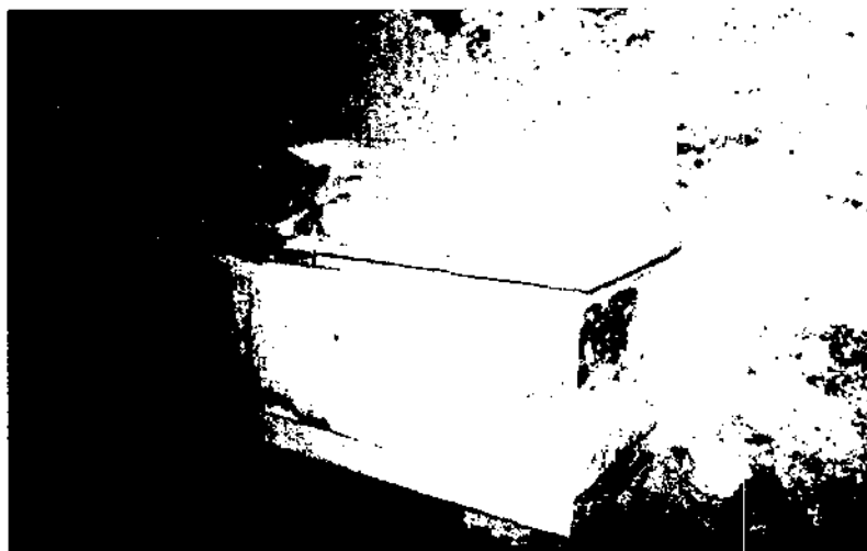
Reconstrucció del sarcòfag de Berenguer del Papiol, que es trobava a l'església parroquial de la localitat del Papiol i ara als baixos del castell de dit municipi. Sortosament, es recuperà l'estàtua jaçant de la tapa, realitzada amb un relleu molt poc pronunciat, però molt detallat i ben elaborat.