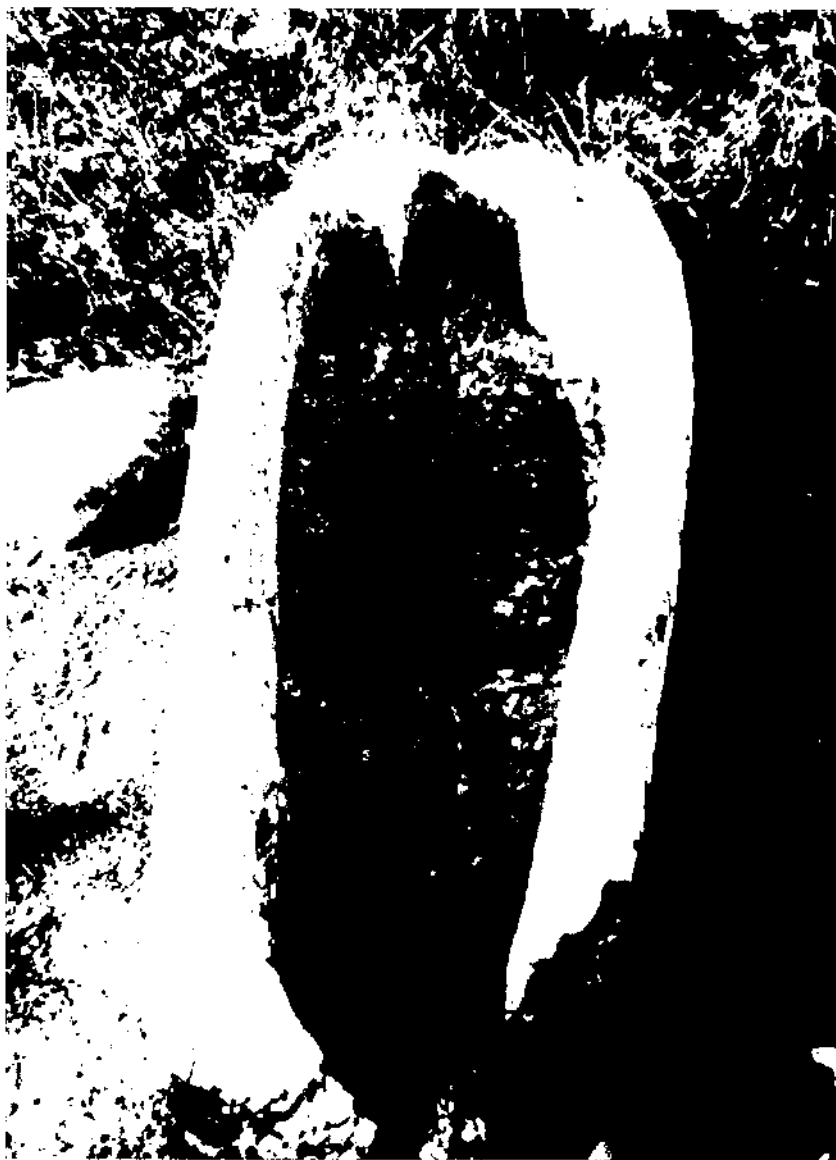
Sarcòfag antropomorf bastant ben treballat, trobat al fossar de Sant Pau d'Ordal de Subirats. Actualment servat dins l'església.