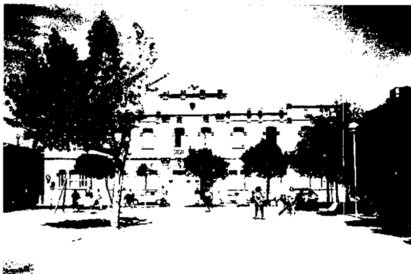
Edifici de les Escoles Noves (1905) (ara Escola Vilarnau), a la plaça coneguda popularment com a «plaça Nova», obra de Miquel Madurell.

A la plaça Nova hi ha l'edifici de les Escoles, les obres del qual es van enllestir cap a l'any 1905. A Sant Sadurní ja es parlava de la necessitat d'unes aules noves des del 1880, però no fou fins al 1902 que les paraules es van concretar en una iniciativa tangible. L'edifici té la forma d'una «U» invertida en relació amb la plaça Nova. La façana principal, que correspondria a la base de la «U», té una organització tripartita distribuïda en cinc cossos. Tot i que aquesta construcció és pràcticament contemporània a ca la Maria Sàbat, presenta una manera de fer menys agosarada i més suau en les formes. De fet, aquestes Escoles responen als criteris del modernisme, però la convivència d'elements medievalitzants (les baranes dels balcons del cos central), amb d'altres de referent clàssic (les pilastres amb capitells a la manera