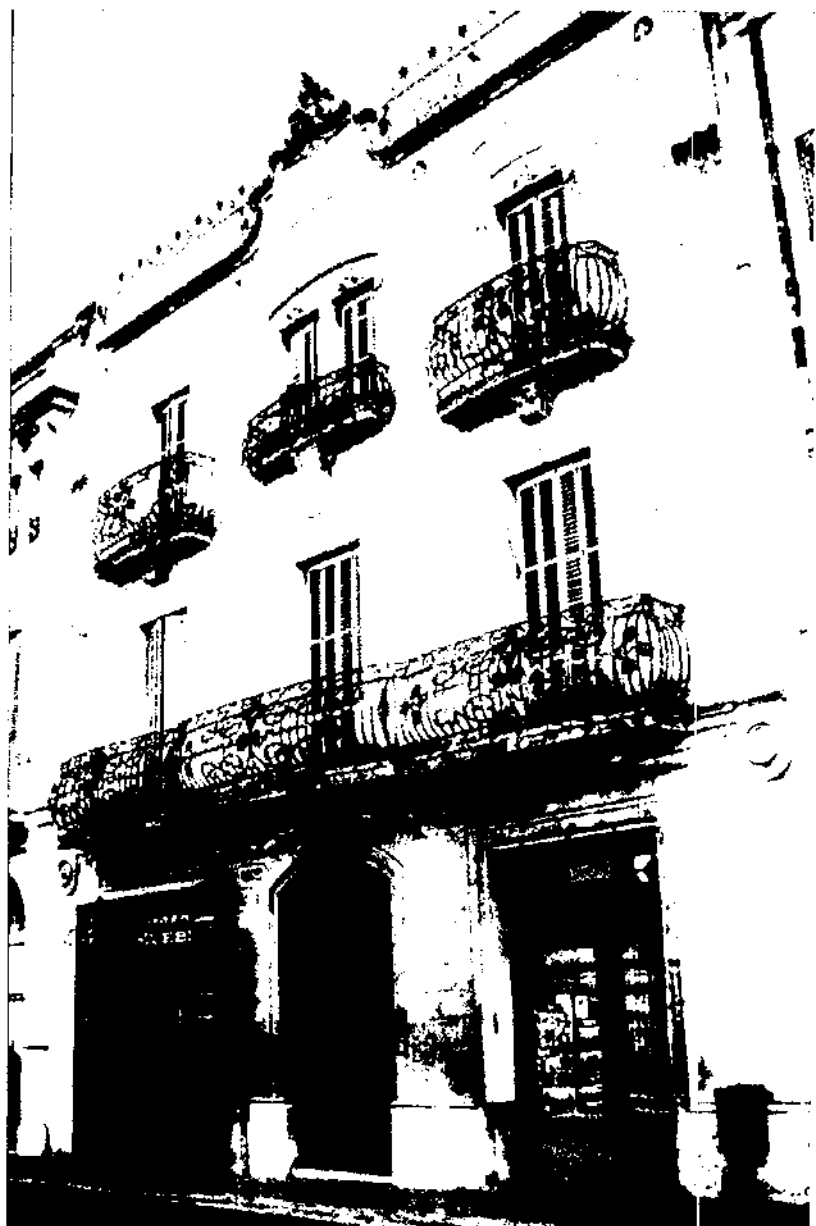
Casa de Lluís Mestres (1909), l'obra més representativa de Santiago Güell a la vila. Està situada al carrer del Raval, núm. 25.