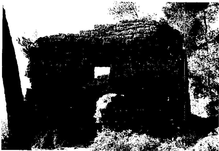
Dins el territori del castell de Cervelló es demostra documentalment un poblament anterior al segle X.