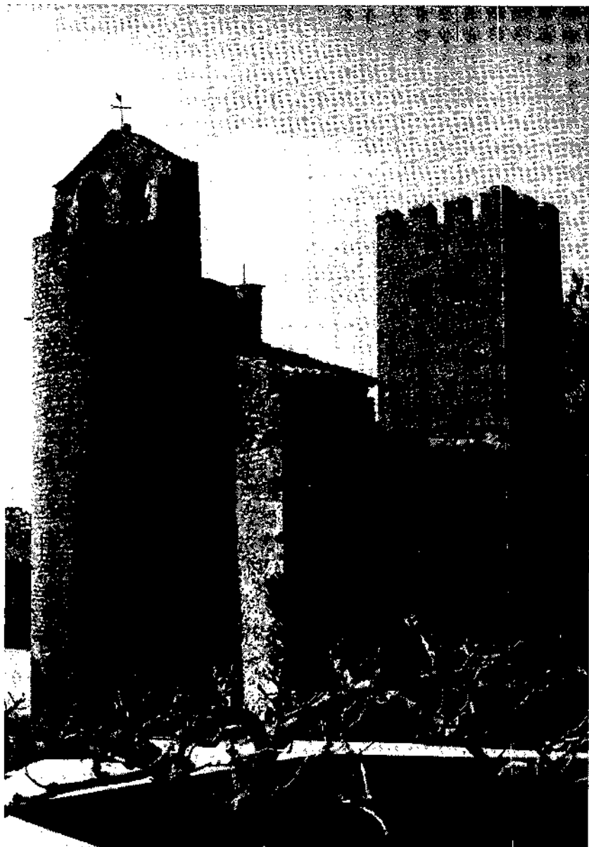
El lloc de Santa Oliva és esmentat en un document de l'any 971 i en el precepte de Lotari del 986.