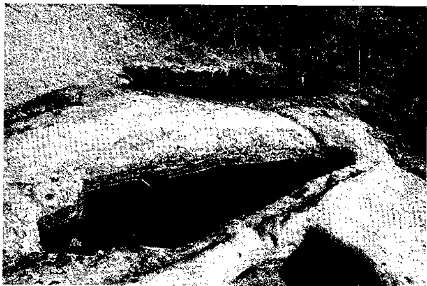
Sepultura antropomorfa del castell de Cervelló. Aquest tipus d'enterraments ens evidencia, així mateix, l'existència d'un poblament a la zona entorn al segle X.