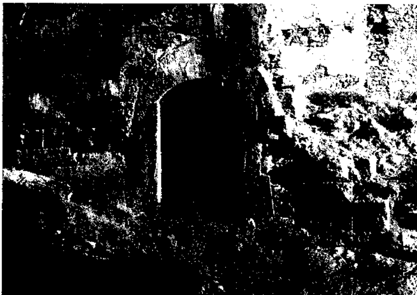
El terme de Calders es creu que era poblat entorn el 875-877, no obstant, els vestigis de poblament més antic corresponen al castell de Calders, del qual únicament queden algunes romanalles.

Aquí trobem el primer esment documental conegut del terme de Lavit (en la font «Kastrum Vidde»). El document ens informa de diversos