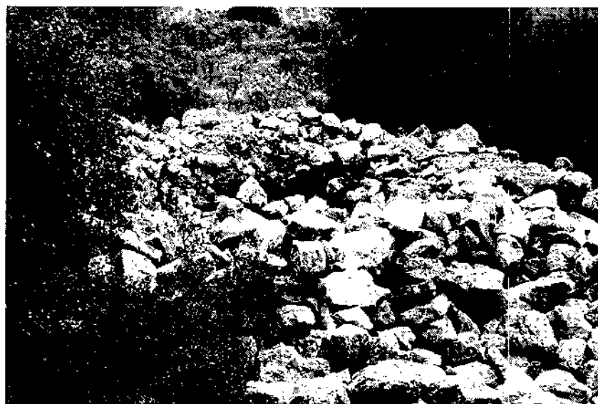
Un document dona testimoni d'unes construccions antigues que hi havia a la zona del castell de Subirats, probablement al Pujol d'en Figueres.