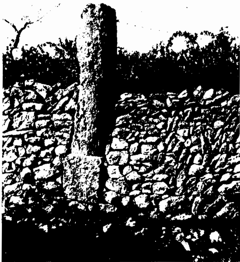
Miliari del Vendrell "in situ". En ésser identificat es trobava prop del km. 27 de la carretera de Tarragona.