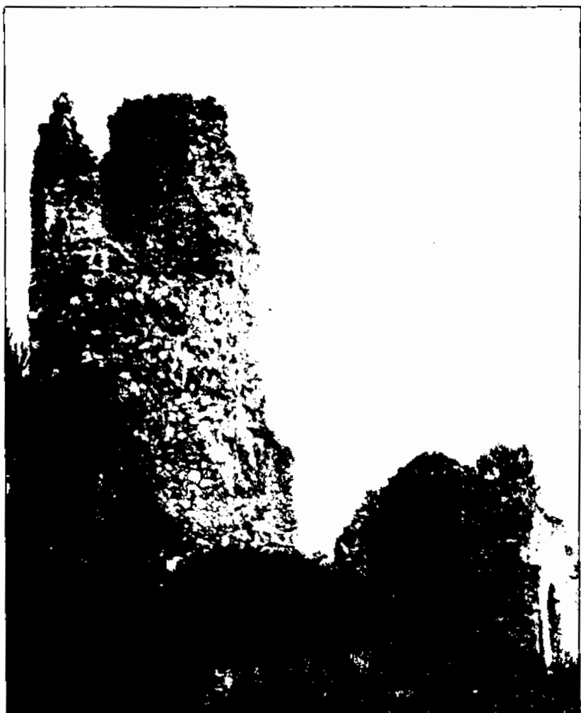
Restes del castell i l'església de Sant Miquel de Castellví de la Marca.