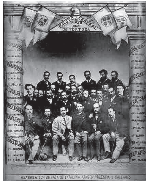
Fig. 2. Imatge de la reunió del Pacte Federal de Tortosa, 1869. Al peu s'hi pot llegir "Asamblea Confederada de Cataluña, Aragón, Valencia y Baleares"