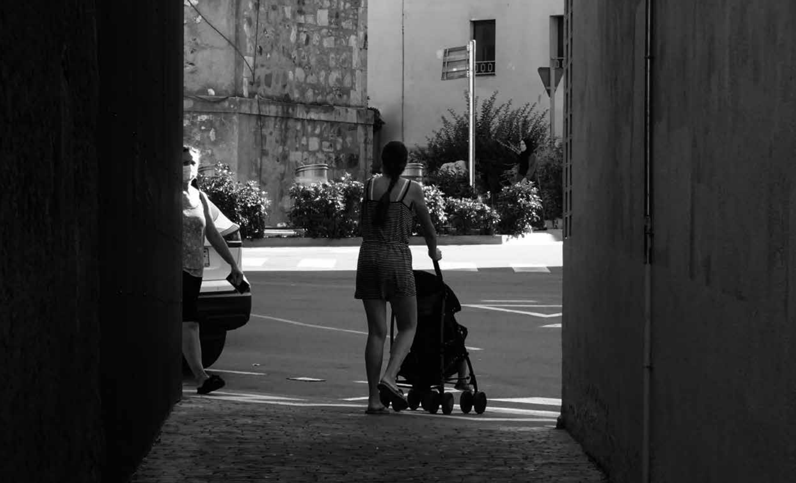
Malgrat que els homes actualment ja fan algunes feines de l'àmbit domèstic, encara les dones són les que més s'ocupen de la canalla com en aquesta fotografia en què veiem una dona jove passejant el fill en cotxet aquest estiu al corraló de l'Hort de la Sorda de Riudoms.

necessiten per sobreviure cada dia de la vida, però especialment en moments de feblesa com la infantesa i la vellesa, és una tasca essencial, però no ha tingut aquesta consideració. La nostra societat ha donat un més alt valor a la producció de béns i capitals que a la reproducció de les persones i és així que les feines que diàriament han fet les dones durant generacions han esdevingut invisibles. Aquesta manera de pensar l'atribució de tasques socials ha creat una situació de gran desigualtat entre homes i dones (la «bretxa de gènere») i ha provocat que les dones siguin més pobres, més dependents, que tinguin feines més precàries, que els costi més assolir l'èxit professional, que hagin participat menys en associacions i moviments socials, que hagin tingut menys capacitat de participació social, econòmica i política. És així que les dones sembla que no hi siguem, com si no haguéssim passat per aquest món malgrat haver contribuït tant a sostenir-lo.