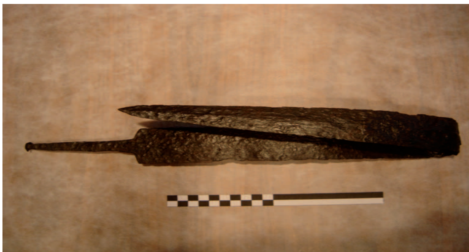
Espasa celtibèrica de tipus La Tène, doblegada ritualment, procedent de la sepultura C de la necròpolis de La Revilla.

pretacions o manifestacions materials com a resultat directe de la seva localització en un territori culturalment tan ric i divers. Una de les interpretacions més singulars, també centrada en un territori no menys ric i divers, tingué lloc a la Península Ibèrica (García