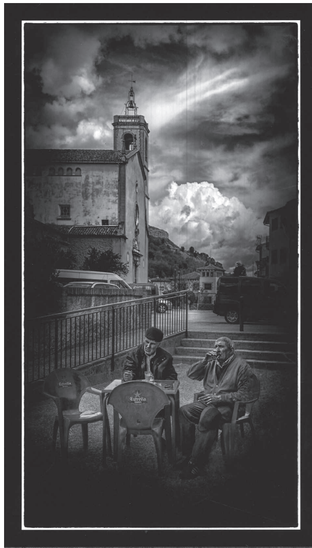
Concurs "Castell d'Or". Primer Premi Tema Tona