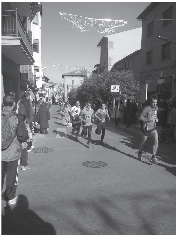
Participants de la 35a Cursa Atlètica Popular, el dissabte 7 de desembre, al seu pas pels carrers Major i de Barcelona

Política (27-12-13): El ple municipal aprova per unanimitat els pressupostos per al 2014. Pugen a 8,2 milions d'euros, dels quals 1,4 són per a inversions.