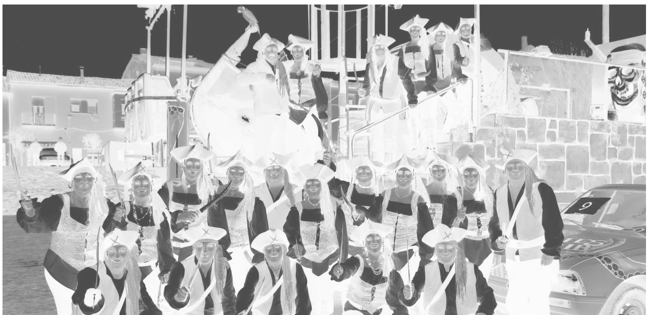
Una de les comparses de la cercavila del carnaval a l'esplanada de la Canal

Cultura (15-03-13): Núria de Gispert, presidenta del Parlament, presenta l'edició del diari perso-