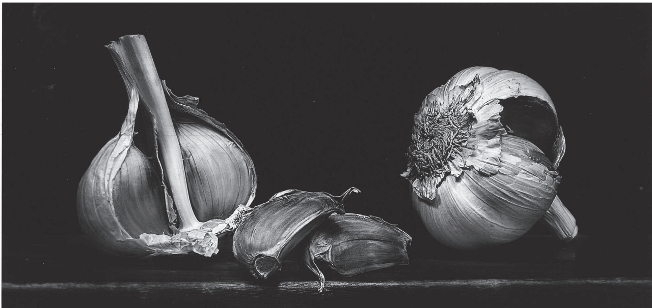
Concurs "Castell d'Or". Primer Premi Tema Lliure

Un fons documental de 28.500 volums, entre llibres i revistes; 4.600 usuaris inscrits, i 19.000 visites i més de 39.000 serveis de préstec l'any passat.(...) Destaca el projecte "Lletra menuda", una adaptació a escala local del projecte "Nascuts per llegir", que porten a terme conjunta-