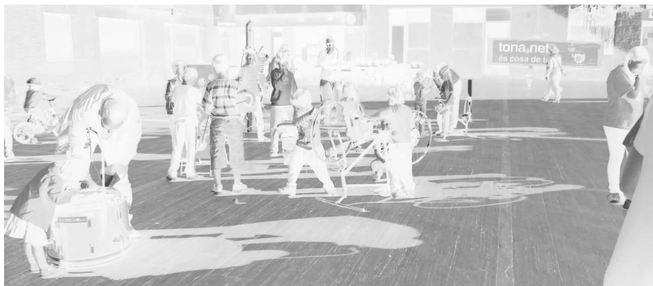
Inici de la campanya tona.net@ a la plaça Major

Cultura (06-04-13): Concert de música religiosa per part del Cor Bonaire (església de Sant Felip Neri, Vic).