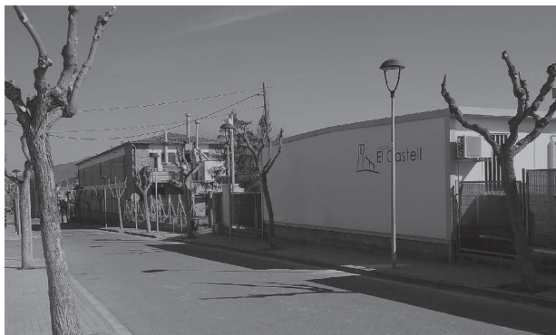
Vista de l'escola El Castell i de l'escola bressol La Cuca Fera.

Des del mateix moment de saber-se la notícia el dijous 15 de febrer, la pressió de pares, mares, alumnes i mestres, a més de les negociacions de l'Ajuntament, els dies posteriors, han salvat almenys temporalment l'Escola El Castell, en