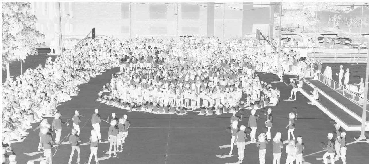
Un moment de la celebració dels vint-i-cinc anys de l'escola L'Era de Dalt

Medi ambient (19-04-13): Els nens de les escoles planten arbres al polígon Goules com a part de la campanya Tona.net@.