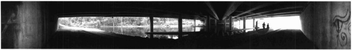
Imatges panoràmiques dins el projecte Piste re-cyclable .

a part. Allà si tens talent, per més jove que siguis, pots tenir fins i tot l'oportunitat d'exposar en un museu nacional. I això motiva molt, perquè no t'has de vendre, sinó que si l'obra és bona es ven sola i se t'obren portes.