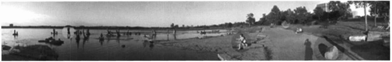
Imatges panoràmiques dins el projecte Piste re-cyclable .

disciplines que els poden servir per explorar. Però no és només per les divisions, sinó que també l'Estat determina una jerarquia de coneixements en què l'educació visual no és precisament la que ha sortit més ben parada de les retallades horàries de les matèries del món humanístic. Aquestes hores han anat a parar a més hores de llengües o de matemàtiques... No penso que aquestes no siguin necessàries, sinó que el que em pregunto és per què són més necessàries que l'educació artística i humanística... De què serveix no fer cap falta si no tens res a dir perquè no t'han ensenyat a pensar o a assumir la teva cultura o el teu patrimoni?