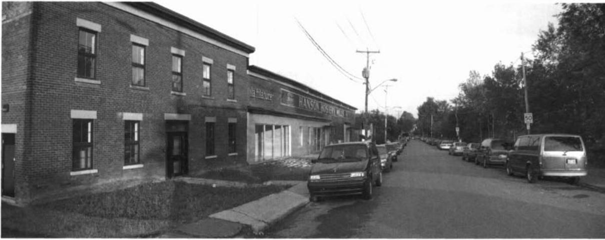
Vista de l'estudi-taller de l'espai de residents durant l'estada de Pere Báscones al Quebec.