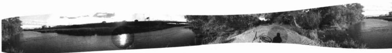
Imatges panoràmiques dins el projecte Piste re-cyclable .

Al Quebec, es funciona molt per dossiers i per comissions que valoren el teu treball, i si interessa, tens possibilitats. Aquí tenim Incívics , que aposta per gent jove, però les galeries és un altre món