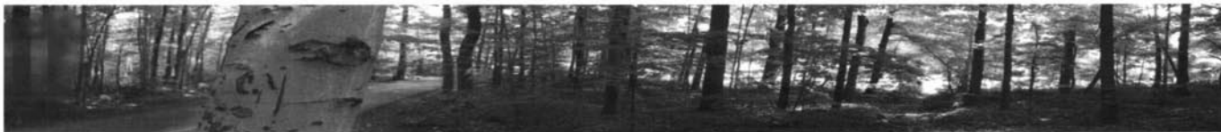
Imatges panoràmiques dins el projecte Piste re-cyclable .

i els new media . Funciona com un servei per a artistes, i el centre mateix s'ocupa del manteniment dels equips. Daimon disposa d'una sala polivalent i de petites sales per a vídeos i ordinadors, i també té un gran laboratori de fotografia.