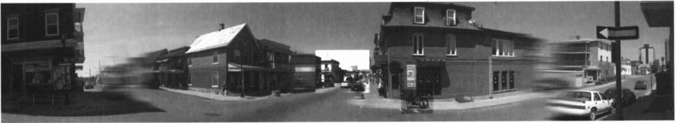
Imatges panoràmiques dins el projecte Piste re-cyclable .

una revisió d'altres èpoques, basades per exemple en el paisatge (com és propi de la tradició pictòrica del Quebec), però això no podríem comprar-ho en una galeria d'art emergent, perquè aposta més per la innovació.