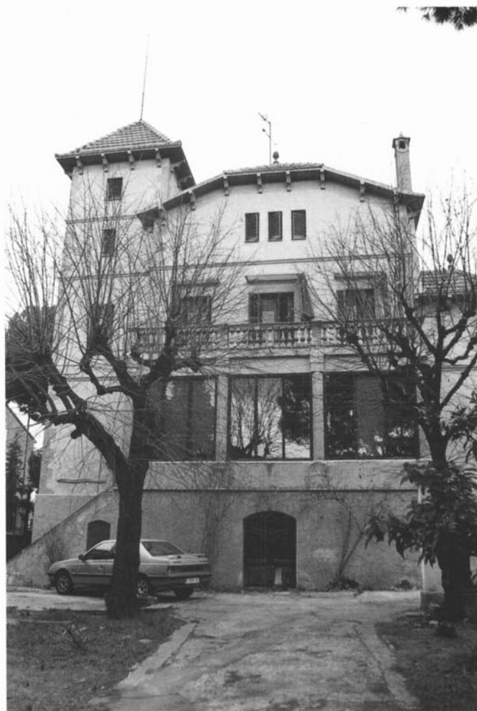
Can Torrents, seu de l'Arxiu de la Memòria Popular.

conèixer a fons les seves activitats, ens va semblar la iniciativa idònia per als nostres objectius. D'aquesta manera, l'any 1997 es va formar el Comitè Promotor de l'Arxiu de la Memòria Popular de la Roca del Vallès amb la participació de la Regidoria de Cultura de l'Ajuntament i un grup de veïns del municipi. Al mateix temps, es va convocar la primera edició del Premi Romà Planas i Miró de memorials populars. Finalment, a principis de 1999, aquest Comitè es va transformar en l'Associació d'Amics de l'Arxiu de la Memòria Popular, que porta la gestió de l'Arxiu en col·laboració amb l'Ajuntament.