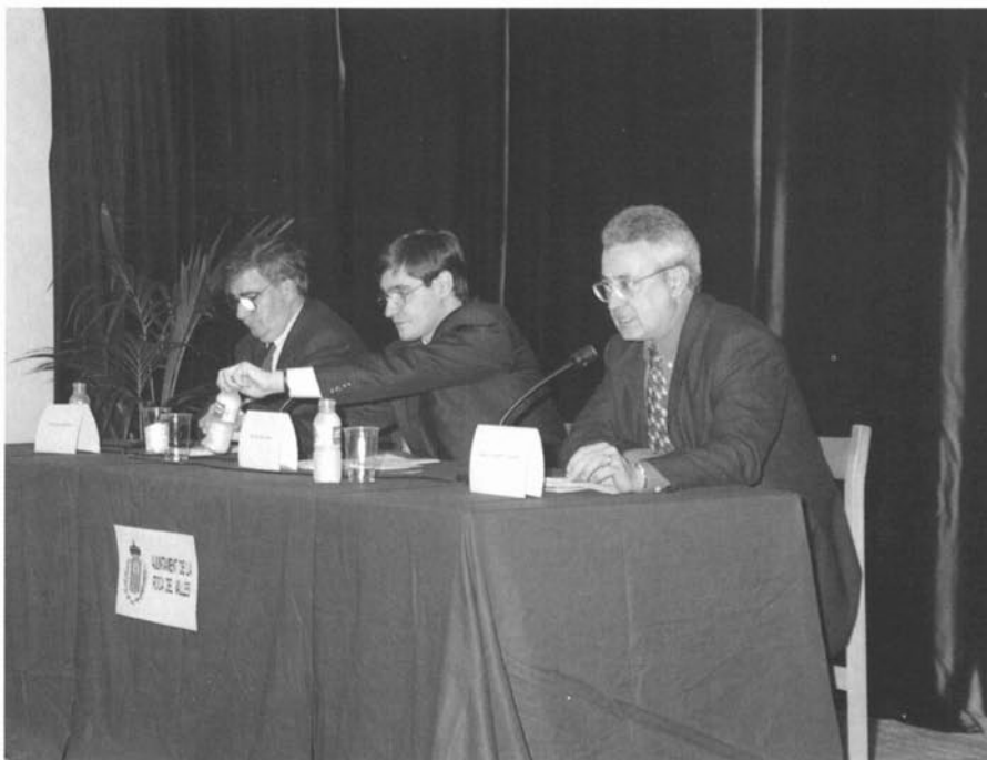
Acte de presentació de l'Arxiu al poble de la Roca del Vallès: l'alcalde, Salvador Illa, al centre; el regidor de cultura, Jaume Domènech, a la dreta, i Ernest Lluch, president del Jurat del Premi, a l'esquerra.

El Premi té caràcter internacional i està obert a totes les llengües de l'Estat espanyol, ja que el nostre desig seria esdevenir punt de referència i centre de trobada per a l'estudi de la memòria i l'escriptura popular a la península.