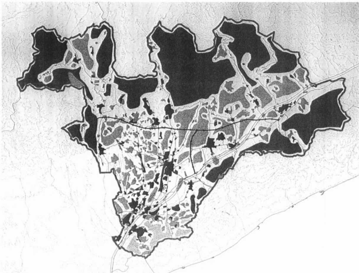
Mapa 3: el Vallès Oriental: planejament viari i paisatges vallesans.