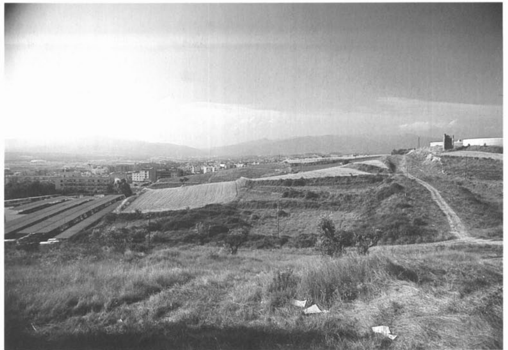
Zona de la torre Pinós.

A més a més, s'observa que tots els boscos es localitzen al llarg