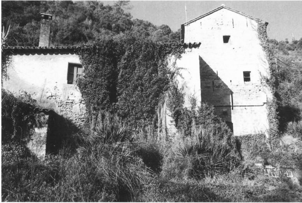
Casa dels moliners i torre fortificada del molí amb les espitlleres allargades de l'època medieval a la façana.