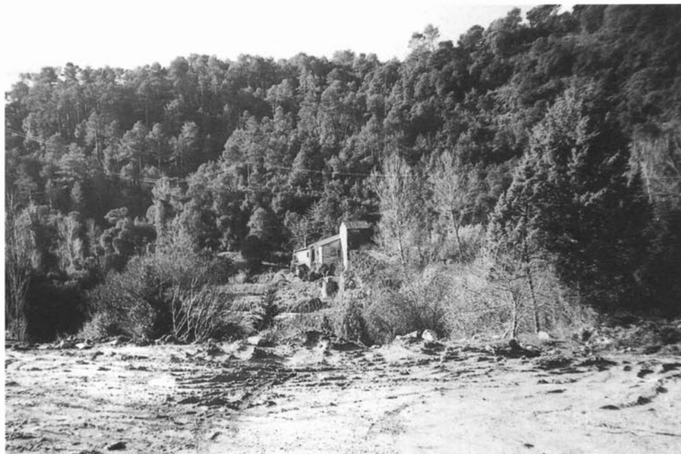
Panoràmica del molí de Llobateres i de la serra de les Planes vist des del mas les Torres.

El molí es troba recolzat a la serra dita de les Planes, que culmina amb el Fitor i la finca del mas Flequer de Sant Feliu de Codines, a l'extrem d'una gran recolzada que fa el Tenes abans d'abocar-se vers els espadats del Fai. Presideixen la petita vall que hi ha enfront del molí el gran mas de les Torras i un grup de cases residencials modernes. El molí és perfectament accessible