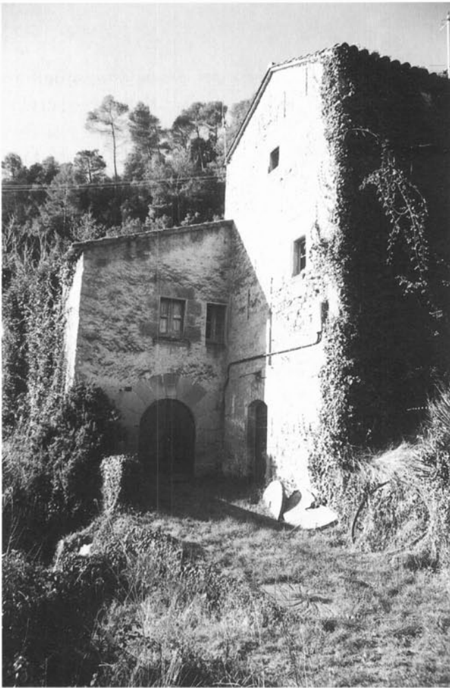
Torre del molí de Llobateres, casa dels moliners a mà esquerra i restes de moles antigues al primer pla.

un plet o discussió que Pere de Castellet, prior del Fai, mantenia amb el senyor de Centelles sobre aquest últim molí 8 .