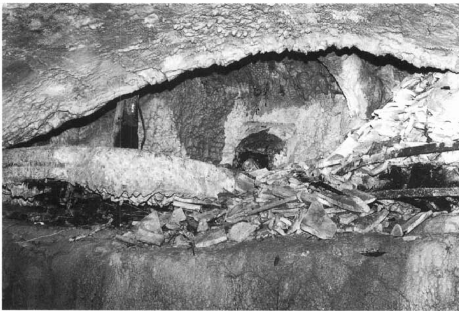
Interior del carcabà del molí de baix amb les restes de la mola i del rodet. Està en molt mal estat de conservació.

en el qual després d'esmentar els dos molins de Llobateres o antics molins de Centelles situats prop la torre, diu "també tot aquell molí draper, construït en la mateixa parròquia de Sant Quirze Safaja, noves rescloses i qualsevols altres paraments necessaris per moldre en el molí que de nou construïreu".