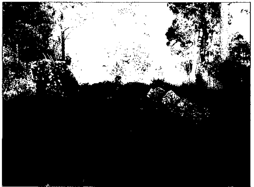
Dòlmen de Cruilles