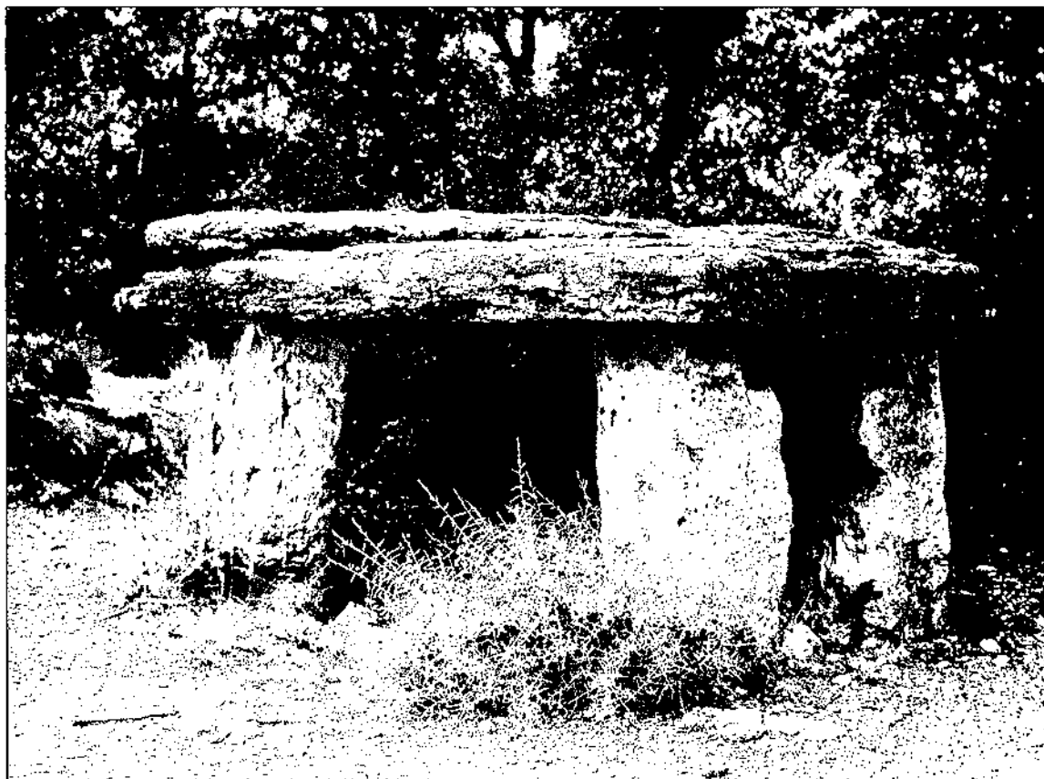
Dolmen de la Costa de can Brull

Fortià Solà en el seu llibre (1932:10): "Aquest megàlit, certament notable, vaig descobrir-lo jo mateix, a finals de 1914, orientat pel nom arca que sovint porten aquestes construccions".