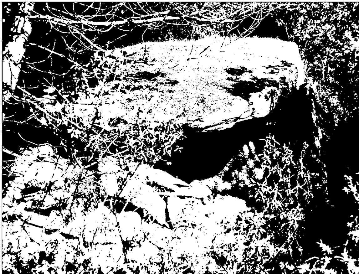
Dolmen de Sant Miquel de Conyelles

de 2 lloses laterals, 1 de capçalera i la cobertera. A la part anterior presenta restes de parets seca, si bé sembla que ha estat fruit de recondicions més moderns. Es desconeix l'existència de restes arqueològiques.