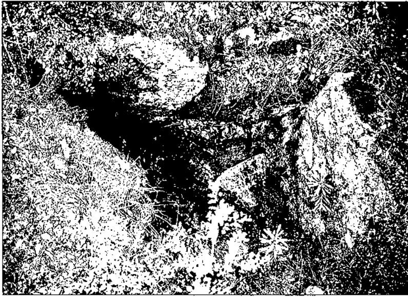
Dolmen Creu de Porròquia

grafia tradicional, apareix identificada com a cista tancada. Formada per quatre grans lloses, dues d'elles caigudes sobre el túmul circular, el qual ocupava un espai de 7 m de diàmetre. Les restes aparegudes constaven d'alguns fragments ossis, 7 dents i diversos fragments de ceràmiques informes. L'escassetat de restes fou atribuïda a la seva utilització com a refugi de pastors. Amb posterioritat l'estructura original va estar modificada pel propietari de la finca. En la reexcavació efectuada per Batista (1963) no hi va aperèixer res.