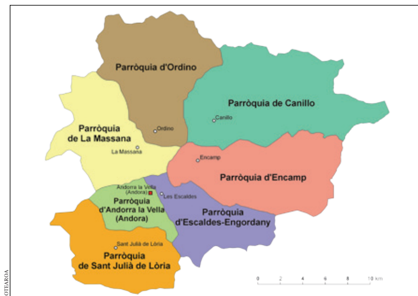
Figura 1. Andorra i les parròquies

Aquest article es basa en dades recopilades durant dues estades a Andorra (juliol i agost de 2015 i octubre i novembre de 2015). Vaig gravar 19 biografies lingüístiques (Crapanzano 1984, Pavlenko 2007) d'immigrants amb historials diversos, mantenint el centre d'atenció en les seves trajectòries d'aprenentatge de llengües i les seves ideologies lingüístiques. En tots