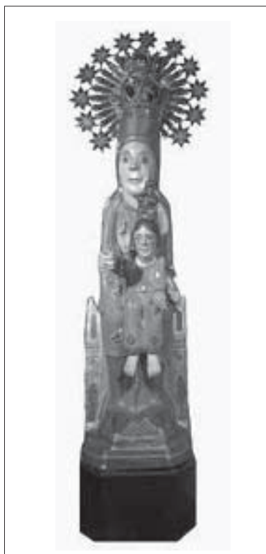
Maredeu romànica de Refet