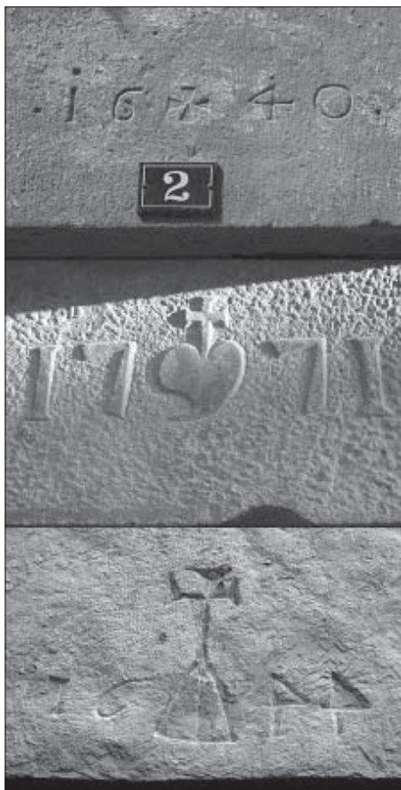
Llindes del període de Montserrat.

No tenim referències personals sobre el tarannà religiós dels habitants d'Artesa de Segre i comarca entre els anys 1500 al 1800, però si jutgem aquesta condició pels fruits que donà a partir del s. XIX entenem que el sentiment religiós estava fortament arrelat entre la població. Constatem aquesta religiositat en l'expressió gràfica esculpida a les llindes i dovelles de les portes de les cases complementades amb l'any de construcció. Per aquesta identificació de la casa si bé des de la visió laica s'hi gravava l'escut familiar o algun motiu que fes referència a l'ofici dels propietaris, des del sentiment de religiositat s'utilitzaven decoracions amb simbologies cristianes com ara creus, sexifòlies, custòdies, símbols epigràfics de Jesús i de Maria, a més d'altres motius d'estètica religiosa que, a més, feien les funcions de protecció espiritual de les famílies que habitaven la casa. A Artesa, Colldelrat, Collfred, Alentorn, Seró, Tudela, Vall-llebrera i Vilves han perdurat diverses llindes amb aquestes simbologies, les quals seran motiu d'estudi en un proper treball ja iniciat