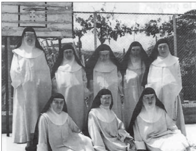
Monges Dominiques Terciaries, 1960, últim any de docència a Artesa de Segre.