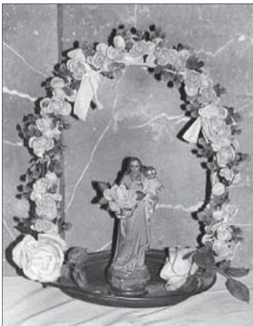
Bacina o safata de plata amb la imatge de la Verge del Roser engalanada.