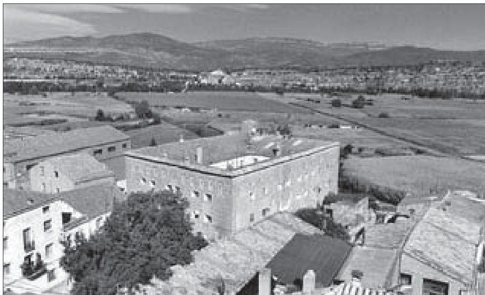
La Granja, la casa de Montserrat a Artesa.

On més es va destacar visualment l'obra arquitectònica del període montserratí fou en la remodelació i ampliació d'esglésies, transicionant-se aleshores diversos temples romànics vers l'estil de l'època, el barroc, i erigint noves construccions. La febre reformadora traspassà de llarg els límits de les possessions benedictines, abastant tot el conjunt de la comarca. Dins del perímetre de l'actual municipi d'Artesa de Segre veiem transicionades les esglésies de Sant Salvador d'Alentorn, Santa Maria d'Anyà, el santuari de Santa Maria del Pla, Santa Maria de Baldomà, Santa Maria de Montargull avui mig enrunada, Sant Miquel de Montmagastre, el santuari de la Vedrenya, Santa Maria de Seró, el monestir-santuari de la Mare de Déu de Refet, Sant Ponç de Vall-Ilebrera i Sant Climent de Vilves.