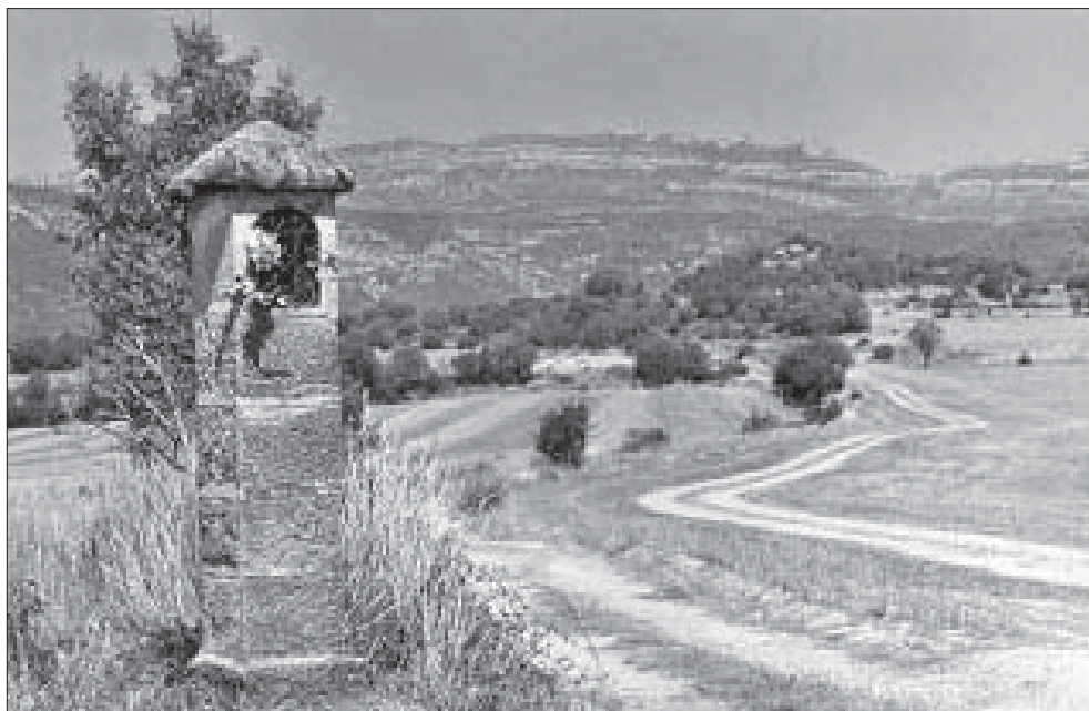
Pedró amb capelleta de Sant Sebastià. Vernet.