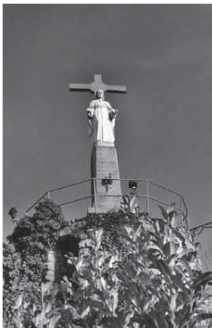
Creu de la Santa Missió a Artesa

Artesa va pertànyer al bisbat de Lleida fins que a l'any 1956 les seves 16 parròquies passaren al Bisbat d'Urgell, a la vegada que aquest cedia per a Lleida i Barbastre les 19 parròquies de la Franja de Ponent, agrupades en tres enclavaments (web Bisbat d'Urgell).