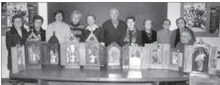
Conjunt de capelletes domiciliaries, o sagrades famíles.

fundà la congregació dels Fills de la Sagrada Família Jesús, Maria i Josep i l'any 1874 creà les Missioneres Filles de la Sagrada Família de Natzaret. En el seu afany de transmetre les virtuts de la família va