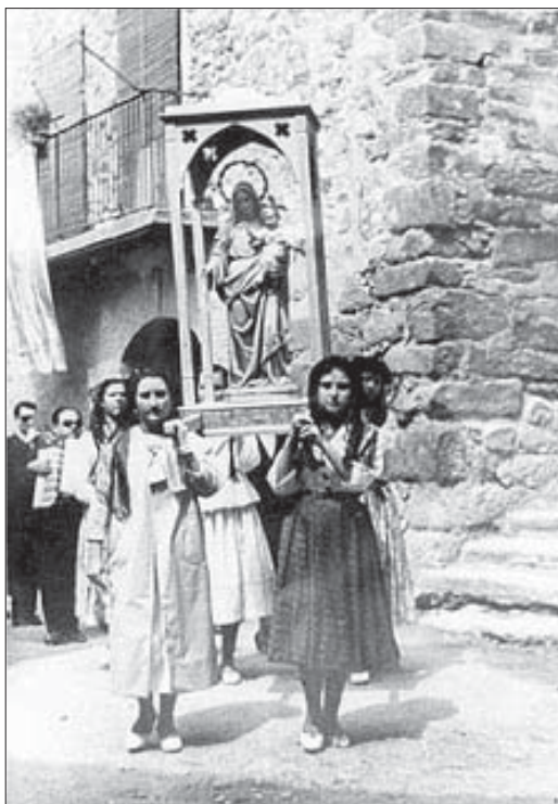
Processó del Roser, Tudela, 1940.