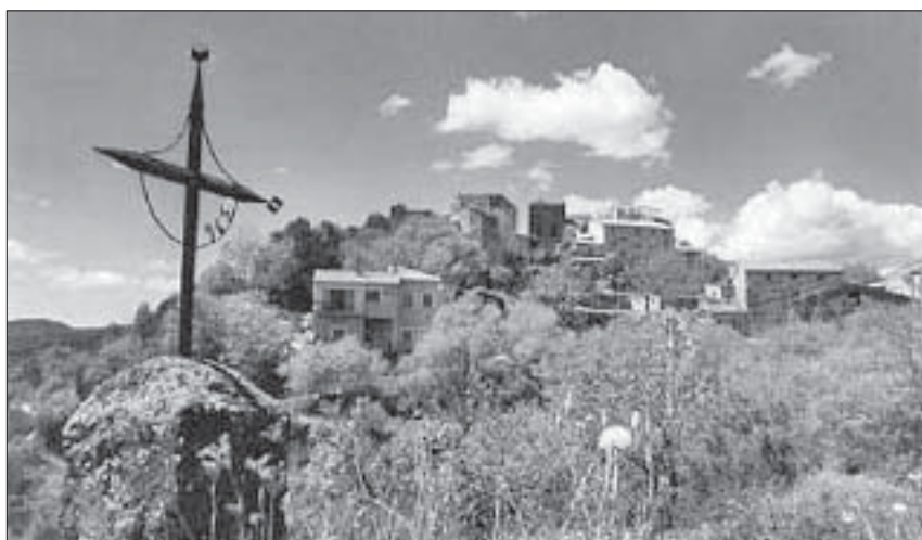
Creu de la Santa Missió . Montargull. 1964.