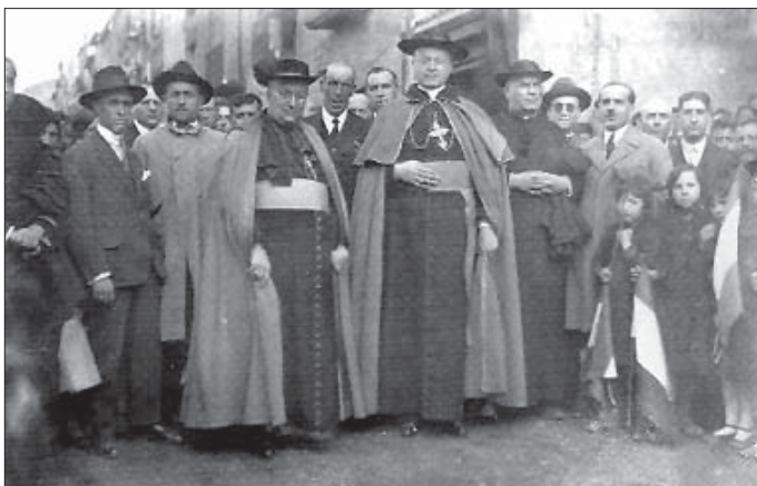
Visita pastoral del nunci del Vaticà, Cardenal Federico Tedeschini. Artesa de Segre, 1928.