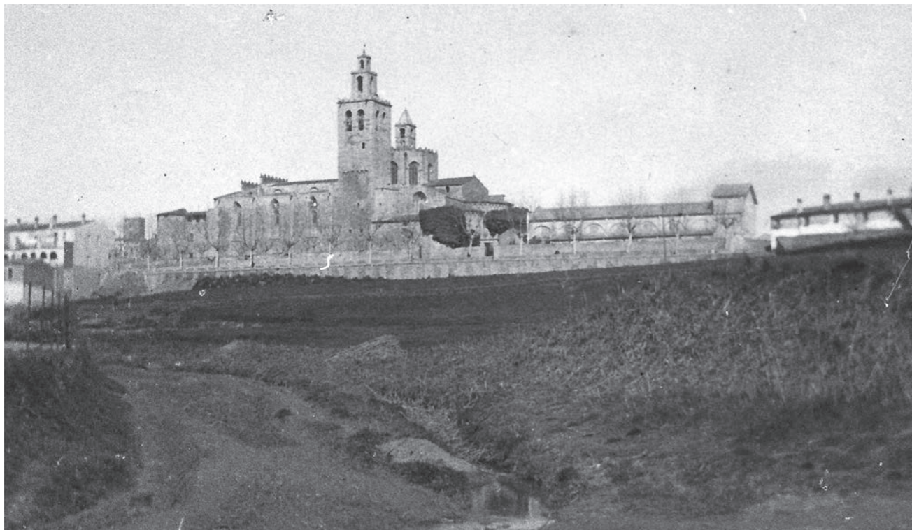
Vista del Monestir de Sant Cugat. A la dreta es pot veure l'edifici de la Sala de Festes del Parc Municipal.

A la Sala de Festes s'organitzaran ballades, sessions de teatre, cinema i cant, i servirà d'auditori per a actes polítics i socials. Al costat, als antics horts es va instal·lar la pista de ball i patinatge i un quiosc de begudes amb la seva terrassa.