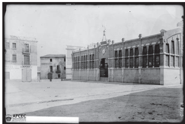
Plaça Major (avui Sant Pere) amb l'edifici del mercat [ca. 1915].