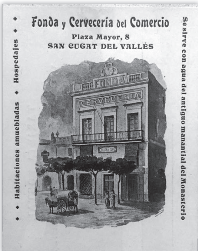
Tarjeta postal de la Fonda del Comercio.